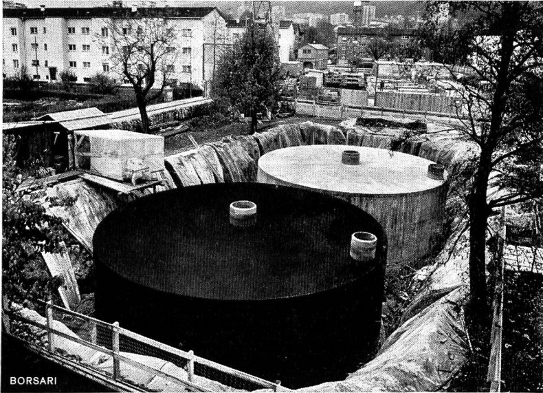
Gemeinnützige Baugenossenschaft Limmattal, Zürich 2 Tanks, total 1 000 000 Liter Heizöl