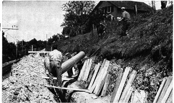
KALIDUR-Kanalisationsrohre, verlegt im Bahneinschnitt