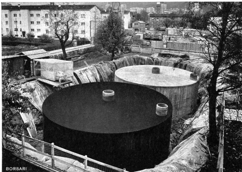
Gemeinnützige Baugenossenschaft Limmattal, Zürich 2 Tanks, total 1 000 000 Liter Heizöl