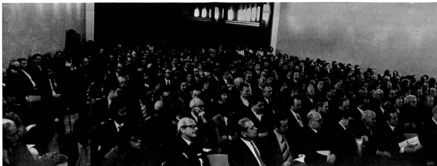
Abb. 2. Die Grndungsversammlung vom 8. Februar 1973 in Vaduz

lassen und ber das Arbeitsprogramm der Gesellschaft fr Umweltschutz zu beraten. Einen besonderen Akzent erhielt die Grndungsversammlung vom 8. Februar durch die Anwesenheit des Landesfrsten Franz Josef II., der damit einmal mehr sein Interesse an den aktuellen Problemen des Landes bekundet hat.