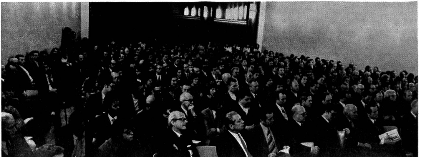
Abb. 2. Die Gründungsversammlung vom 8. Februar 1973 in Vaduz

lassen und über das Arbeitsprogramm der Gesellschaft für Umweltschutz zu beraten. Einen besonderen Akzent erhielt die Gründungsversammlung vom 8. Februar durch die Anwesenheit des Landesfürsten Franz Josef II., der damit einmal mehr sein Interesse an den aktuellen Problemen des Landes bekundet hat.