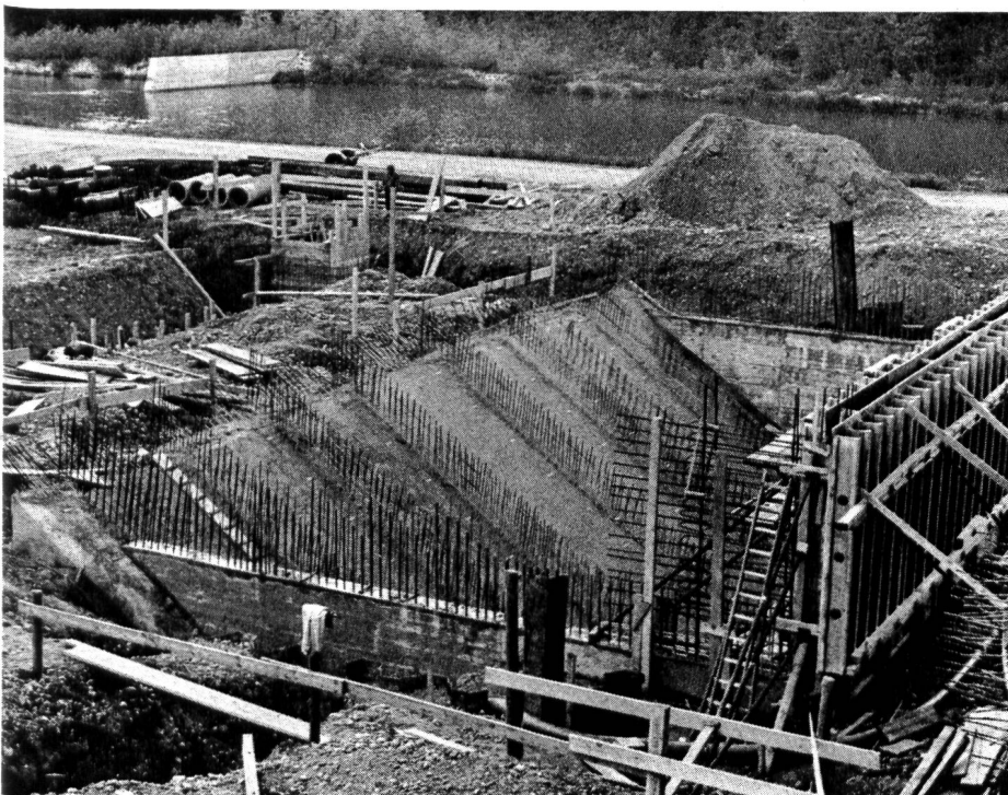
Abb. 2. Noch wird hier gearbeitet, doch schon bald werden die Schneckenpumpen montiert sein und ihre Arbeit aufnehmen können

Da das gewachsene Terrain auf Kote 427,0 liegt, musste der Foundation bzw. der Tiefenlage der Bauwerke spezielle Bedeutung