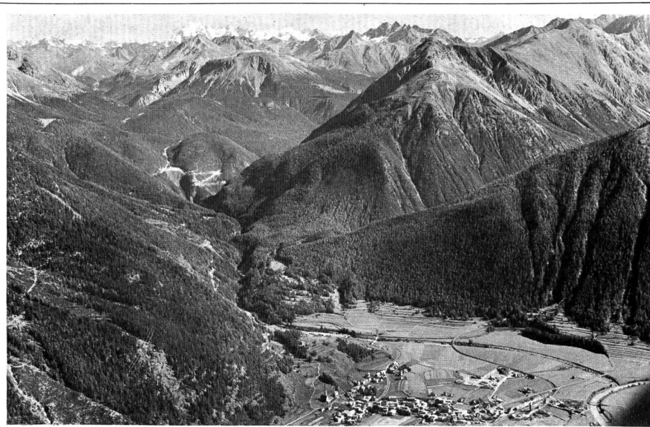
Der Schweizerische Bund für Naturschutz hat an der Delegiertenversammlung in Zug beschlossen, den Nationalpark in eine öffentlich-rechtliche Stiftung umzuwandeln. Wenn diese Zielsetzung verwirklicht werden kann, will der SBN seinen Nationalparkfonds von 1,2 Mio Fr. dieser Stiftung übertragen und auch weiterhin grosse Kostenanteile übernehmen. Unser Flugbild zeigt Zernez im Vordergrund mit dem Nationalpark

Extensivierung der Produktion und damit mit einem relativ geringeren Angebot zu rechnen. Längerfristig lässt sich allerdings wenig aussagen.