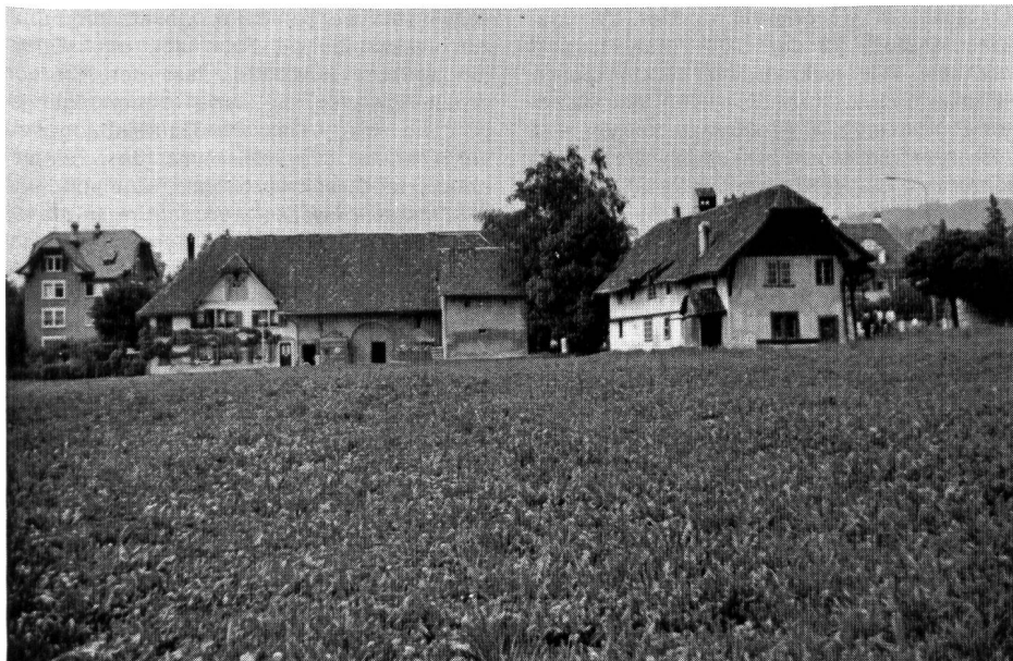
Abb. 1. Die baulich bereits genutzten Parzellen (1 und 2 im nebenstehenden Gesamtplan) in der Grösse von insgesamt 3000 m 2 sind heute im Besitz der Stadt Solothurn. Die Grundstücke unterliegen gewissen Nutzungsbeschränkungen im Interesse der Gesamtanlage und des Klosters «Namen Jesu»

Der glückliche Abschluss des Vertrags verdeutlicht wieder einmal, dass die Erhaltung schützenswerter Objekte auch dann möglich ist, wenn verschiedenartige Forderungen anfänglich unvereinbar erscheinen. Die Grosszügigkeit beider Seiten vermittelt der Bevölkerung der Stadt Solothurn ein weiteres Stück unbeeinträchtigter Ruhe und Tradition und berücksichtigt die berechtigten Anliegen einer Gemeinschaft, die damit am praktischen Beispiel beweist, dass ihr der Dienst am Menschen wichtig ist.