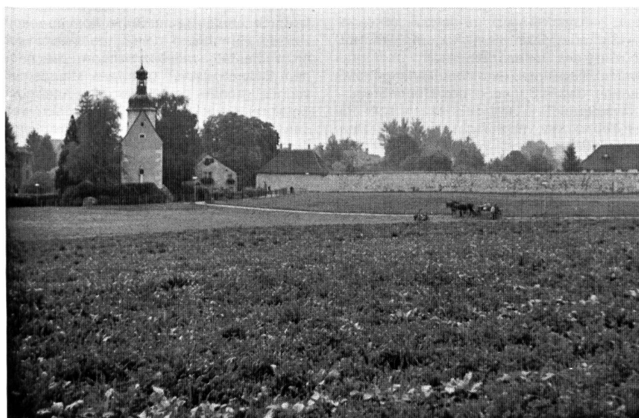
Abb. 2. Ein beschauliches Stück Natur — mitten im Siedlungsgebiet. Die Loretowiese darf inskünftig nur noch landwirtschaftlich genutzt oder mit Kinderspielplätzen und Parkanlagen versehen werden