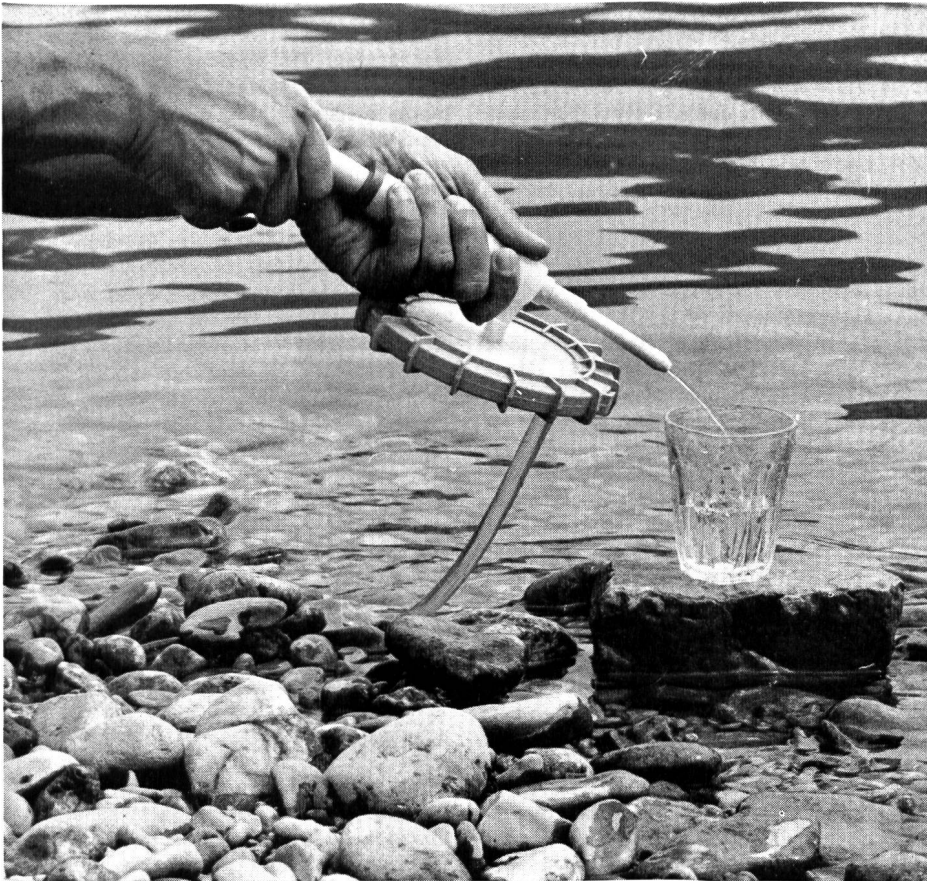
◀ Abb. 1. Das Filopur-Touristenmodell. Mit Handpumpe und praktischem Wassertragsack macht es überall die Entnahme von gesundem und frischem Trinkwasser möglich

Filopuriertes Wasser — Möglichkeit von heute, Notwendigkeit von morgen — ist eine der imponierendsten Lösungen des Trinkwasserproblems.