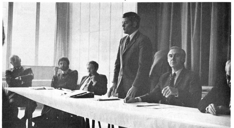
Abb. 3. Die Zeit, die in der Abwicklung der ordentlichen Geschäfte gespart werden konnte, kam dann vor allem der Diskussion und der Information über aktuelle Fragen, die das Gewerbe heute beschäftigen, zugute