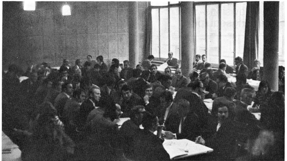
Abb. 1. Eine erfreulich grosse Anzahl Verbandsmitglieder hatte sich zur ordentlichen VTR-Mitgliederversammlung im Hotel Glockenhof in Olten eingefunden. In den Abstimmungen zeigte sich dann sehr schnell, dass «man» mit der Verbandsleitung zufrieden war: Sozusagen alle zur Genehmigung unterbreiteten Geschäfte wurden einstimmig gutgeheissen

es alle, in der Zwischenzeit, entgegen den Parolen von Gewerbe und auch VTR, von Volk und Ständen gutgeheissen wurden. In einem weiteren Referat ging es um die Altersvorsorge und die Taxierung von Heizölrückständen, was besonderen Beifall fand, da Herr Huber von der Oberzolldirektion einige Lockerungen der bisher gültigen Praxis bekanntgeben konnte.