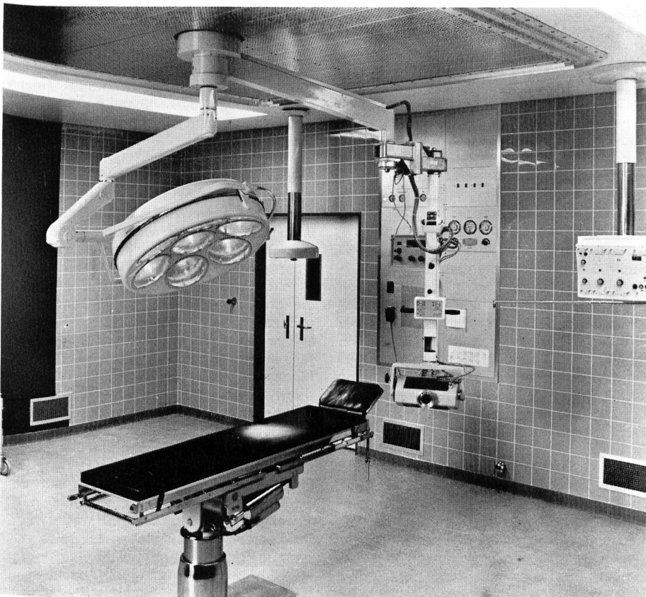
Abb. 3. Hochseptischer OP-Saal mit Al-lander-Decke

sonalwaschraum. Zusätzlich befindet sich zwischen dem Saal für die Knochen-Chirurgie und einem universell benutzbaren Operationssaal ein Raum zur Röntgenfilm-entwicklung. Von den beiden Operations-sälen können durch fest verglaste Nischen die entwickelten, noch nassen Filme betrachtet werden. Zur Desinfektion der Nar-kosegeräte steht im septischen und aseptischen Teil der Abteilung je ein Formalin-desinfektor zur Verfügung. Für Patienten, die einer intensiven Behandlung und Ueberwachung bedürfen, besteht anschliessend an die Operationsabteilung eine chirurgische Intensivpflegeabteilung.