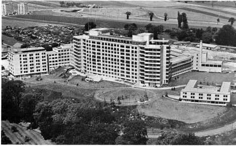
Abb. 1. Kantonsspital Freiburg, Blick von Südosten: Im Vordergrund das Bettenhaus, links davon der Behandlungsbau mit nachfolgendem Personalhaus, rechts im Hintergrund der Wirtschaftstrakt

Steiger Partner AG, Abteilung Krankenhausplanung, 8008 Zürich, im Namen aller am Bau beteiligten Architekten