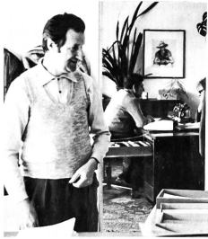
Eine kleine Verschnaufpause im Prüfungsbüro im Werkhof der Stadt Zug

statten gehen können, ausserordentlich dankbar. Die Fachprüfung für Equipenchefs stellt sehr hohe Anforderungen an die Teilnehmer, was angesichts der Bedeutung dieser Prüfung nur zu begrüssen ist. So muss der Kandidat wissen, wie viele Gewässerschutzzonen es gibt und was diese Gewässerschutzzonen ausmachen. Er muss den Inhalt eines prismatischen Tanks berechnen können, und er sollte wissen, wie eine Innenkorrosion entsteht. Eine weitere Frage lautet: Welche elektrische Stromart kann zu einer Korrosion führen? Und ganz besonders wichtig ist sein Verhalten bei einem Unfall. An der Prüfung muss denn der Kandidat auch darlegen, wie er sich bei einem Unfall organisiert. Eine weitere Frage lautet: Welche TTV-Vorschriften sind bekannt über das Verlegen der Produktleitungen und deren Prüfdruck und Konstruktion? Über diese und zahlreiche weitere Fragen muss der Kandidat einer Equipenchefprüfung Bescheid wissen. Die Prüfungskommission des VTR, mit Präsident H. Schneider an der Spitze, verdient grosse Anerkennung für ihren Einsatz zur Heranbildung ausgewiesener Equipenchefs im Tankrevisionsgewerbe.