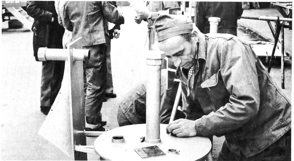
▲ Wird die Arbeit der Prüfung des Experten standhalten?