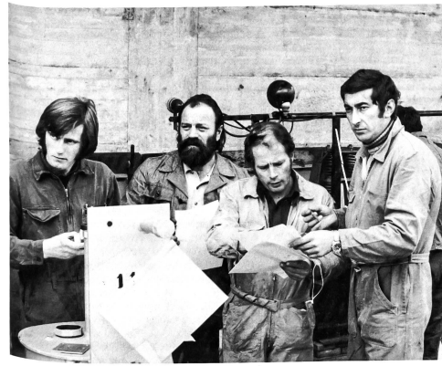
Mit kritischem Blick an der Prüfungsarbeit