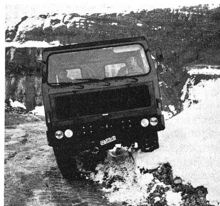
Der Vorteil der Einzelradaufhängung mit Luftfederung zeigt sich hier in der ausgezeichneten Anpassung an das Gelände