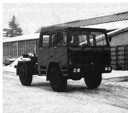
SAB 322 BL, kippbare Doppelkabine, 216-PS-Benzinmotor Ford V8 mit automatischem Getriebe, Radstand 3,0 m, Gesamtgewicht 6850 kg, Nutzlast 3150 kg

Das Sirmac-Lieferprogramm umfasst neben den beschriebenen Motor- und Getriebevarianten auch zwei Radstände von 2,5 m und 3,0 m, sowie wahlweise eine zweiplätzig und eine sechs- bis siebenplätzig Frontlenker-Kippkabine. Verstellbare Lenksäule,