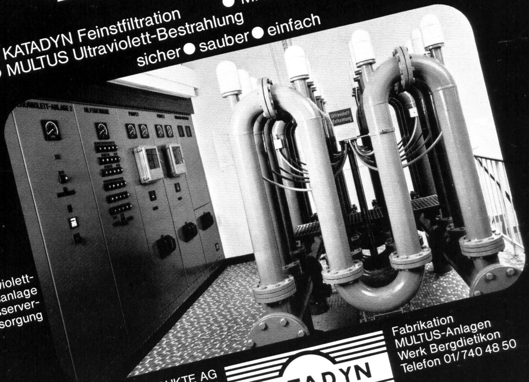
MULTUS Ultraviolett- Grossentkeimungsanlage in Gemeindefwasserver- sorgung

KATADYN PRODUKTE AG Industriestrasse 27 CH-8304 Wallisellen Telefon 01/830 36 77