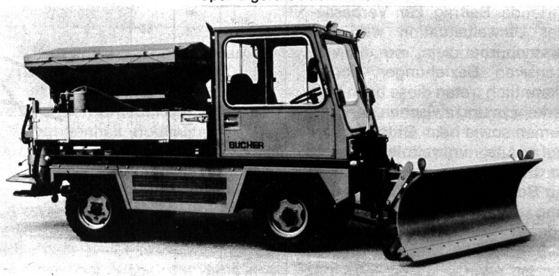
BUCHER- Kommunal- Geräteträger GT 1200