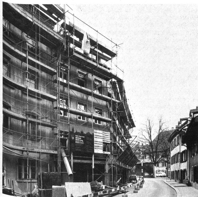
Altstadtsanierung am Beispiel Basel: Rheingasse 61–69.

lichkeit einer fachmännischen Gratisberatung im Hinblick auf eine Aussenrenovation Gebrauch zu machen. Abgesehen von Spezialfällen, die von der Verwaltung übernommen wurden, erfolgte die Beratung durch Fachleute des Hausbesitzervereins oder des Gewerbeverbandes.