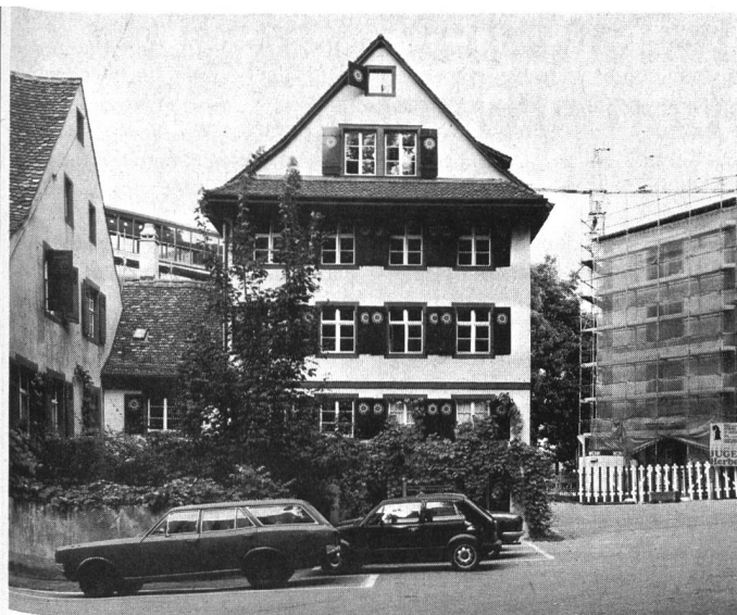
Altstadtsanierung am Beispiel Basel: Haus St. Alban/Kirchrain 12.