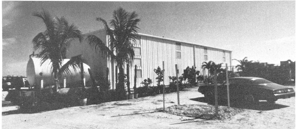
Die neue Umkehrosmoseanlage befindet sich auf Stock Island in der Nähe von Key West, Florida.

Das Meerwasser wird aus zwei tiefen Brunnen in die Anlage gepumpt. Nach Säureeinspritzung, Filtrierung durch fünf Patronenfilter und Behandlung in den B-10 Permeatoren ist das Reinwasser von einer Trinkqualität mit weniger als