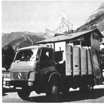
Seit kurzem in Zermatt im Einsatz: Europacker KS 4/Mini, ein überaus wendiger Kehrrecht- und Sperrgutwagen von Ochsner für enge örtliche Verhältnisse. Stahlgerüstaufbau mit Leichtmetallverkleidung, Inhalt 9 m 3 (Chassis Renault 4x4, Breite 2150 mm). Auch ein überfüllter 800-Liter-Container kann problemlos entleert werden.

Das Bestreben nach ständiger technischer Weiterentwicklung im Bereich der rationellen Kehrrichtentsorgung hat in den letzten Jahren bemerkenswerte Erfolge verzeichnet. Die erzielten Fortschritte beschränken sich bei den Ochsner-Produkten nicht nur auf die bekannten Kehrrecht-Sperrgut-Wagen, sondern schliessen auch den Zubehörsektor ein; so lassen sich zum Beispiel Container dank Kehrrechtstopfern besser nutzen. Ochsner hat seine verstärkten Entwicklungsanstrengungen vor allem auf die Rationalisierung, Wirtschaftlichkeit und die Umwelt- und Bedienungs-freundlichkeit der Fahrzeuge und Produkte konzentriert. Der Europacker KS 4/Mini, lieferbar