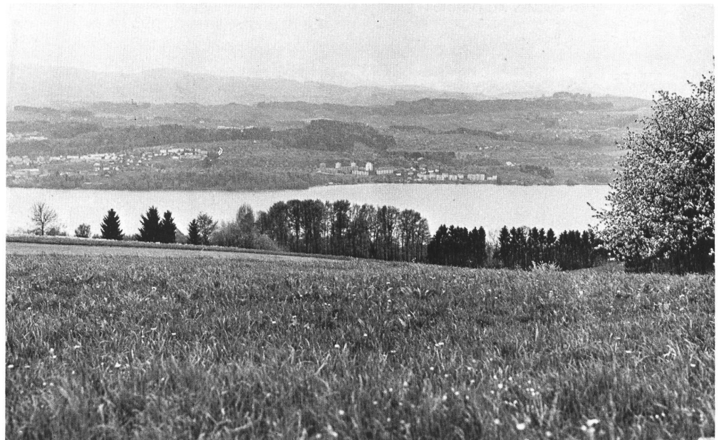
Meilen ZH: Im Gegensatz zu Herrliberg bleibt die Aussicht von den Abhängen des Pfannenstils unverbaut, weil die Bauzone unterhalb der Hangterrasse verläuft.