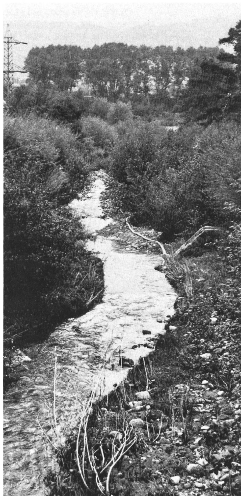
Bachverbauung mit Querwerken, kombinierte Bauweise für Hochwasserschutz mit Gebüschvegetation und Mauerwerk.