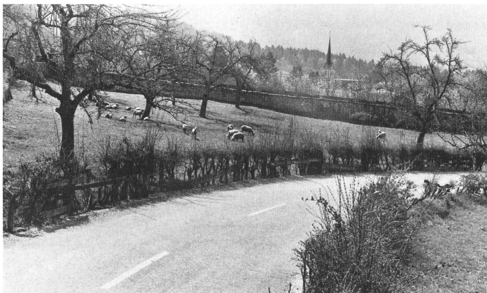
Die Gemeindeversammlung von Tschappina GR hat beschlossen, keine Bauzonen für Ferienhäuser auf privatem Land auszuscheiden. Die Landschaft bleibt für die Landwirtschaft und den Winterskisport erhalten. Neubauten bleiben beschränkt auf eine kleine Ferienhauszone im Besitz der Gemeinde, links unterhalb der Kirche.