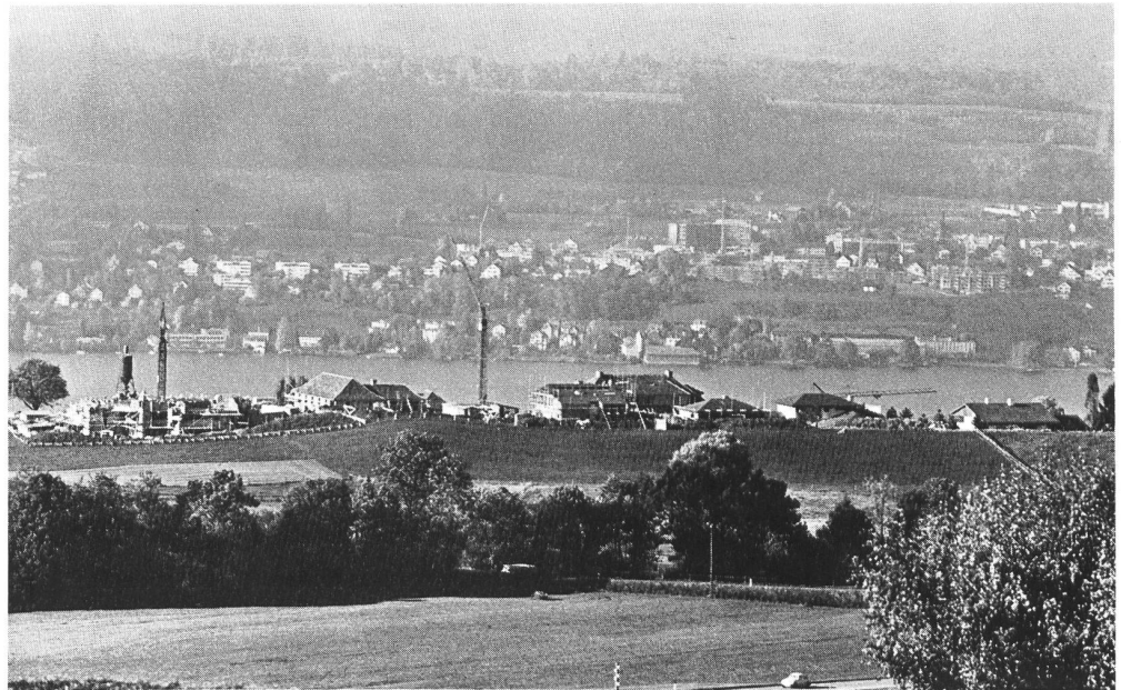
Herrliberg ZH: Die Überbauung folgt der Hangkante und verstellt unnötigerweise den Blick auf den See.

Die fortschreitende Landschaftszerstörung hat ihre Wurzeln in einer Haltung, die man als fehlendes Landschaftsbewusstsein bezeichnen könnte. Schon Mitte der fünfziger Jahre, als ein Plakat des Schweizer Malers Hans Erni mit einem Totenkopfsujet vor der Gefährdung des Trinkwassers warnte und das erste eidgenössische Gewässerschutzgesetz in Kraft trat, begann sich ein Gewässerschutzbewusstsein bei den Behörden und der Bevölkerung zu bilden.