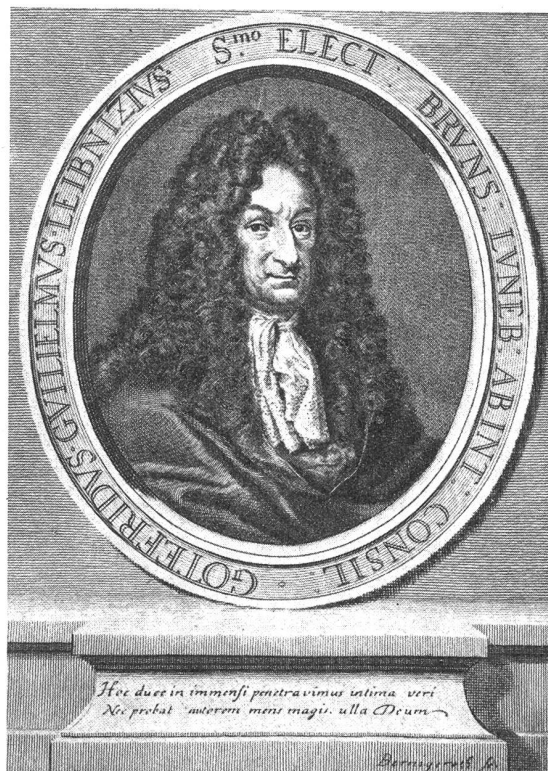
Stich von Berningeroth

stellen konnte. Er erhielt den Auftrag, die beiden Fürstenhäuser nach sechshundertjähriger Trennung durch eine Heirat wieder zu vereinigen, was im Jahre 1695 auch wirklich geschah. Zur Feier dieser Verbindung ließ er eine silberne Denkmünze mit allegorischen Darstellungen prägen (Bild 1).