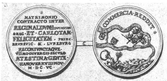
Bild 1: Die von Leibniz entworfene silberne Denkmünze «auf die Vermählung der anderen Braunschweig - Lüneburg - Hannoverischen Prinzessin, Charlotte Felicitat, mit Rainald, Herzogen zu Modena».

Außer dem «Consilium Aegyptiacum» verfaßte Leibniz noch zahlreiche politische Denkschriften, die zum Teil großes Aufsehen erregten. So veröffentlichte er eine Schrift über die Souveränität der deutschen Fürsten und nach der erfolgreichen Aufhebung der Belagerung von Wien im Jahre 1683 eine Spottschrift auf Ludwig XIV., den «Allerchristlichsten König», der sich gegen den Kaiser mit dem türkischen Sultan verbündet hatte. Eine andere, heute kaum bekannte Denkschrift veröffentlichte Leibniz im Auftrag des Königs Friedrich I. von Preußen, als dieser sich 1707 um die Erbfolge im Fürstentum Neuenburg und Valangin bewarb. Genealogische Studien, in denen Leibniz zum erstenmal eine strenge Quellenkritik anwandte – er begründete damit die neuzeitliche kritische Geschichtsschreibung –, hatten das Ziel, die Familiengeschichte des Welfenhauses bis ins frühe Mittelalter zurückzuverfolgen. Leibniz gelang es, die gemeinsame Abstammung der Welfen und des Hauses Este nachzuweisen. Diese historische Entdeckung stand im Dienste einer politisch bedeutsamen Aktion, bei der Leibniz sein diplomatisches Geschick nicht weniger als seinen historischen Scharfsinn unter Beweis