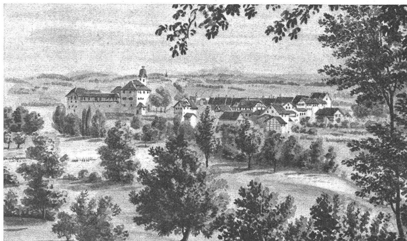
Bild 3: Aquarellierte Zeichnung des Städtchens Grüningen von Süden gesehen, von Schultheß, aus dem Jahre 1836 (Zentralbibliothek Zürich).

Der Groß- und Kleinviehbestand ist gering: 11 Stiere, 27 Kühe, 7 Kälber, 9 Hengste, 3 Stuten, 22 Schweine, 62 Hühner und 49 Tauben wurden gezählt. Nur der Landschreiber besaß noch ein Schaf.