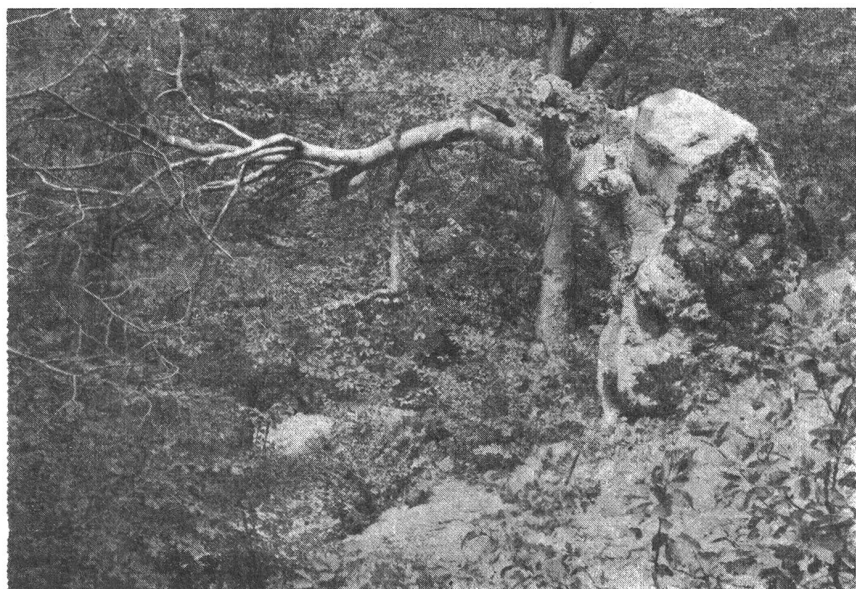
Bild 2: Ist die Ahnung der innigen Verbundenheit im Naturgeschehen unbeteiligt an der Ehrfurcht, die uns der Anblick heimischen Urwaldes einzuflößen vermag? (Ein von vielem Getier zerfressener Buchenstrunk aus dem Wallis)

So kann, genau genommen, die Lebewelt nur richtig verstanden werden, wenn man sie als eine riesige Lebensgemeinschaft betrachtet. Aber welche Vermessenheit, die ganze Welt des Lebendigen in einer einzigen Retorte analysieren zu wollen! Eine Gliederung wird unvermeidlich, wenn wir die Lebensstätten überblicken wollen. Wir müssen aber