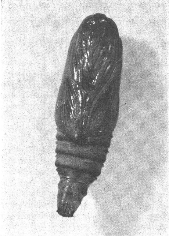
Bild 4: Die Puppen des Lärchenwicklers, die sich, versteckt unter dem Nadelpolster des Lärchenwaldes, aus der Raupe entwickeln und aus denen nach kurzer Ruhezeit die Schmetterlinge schlüpfen.