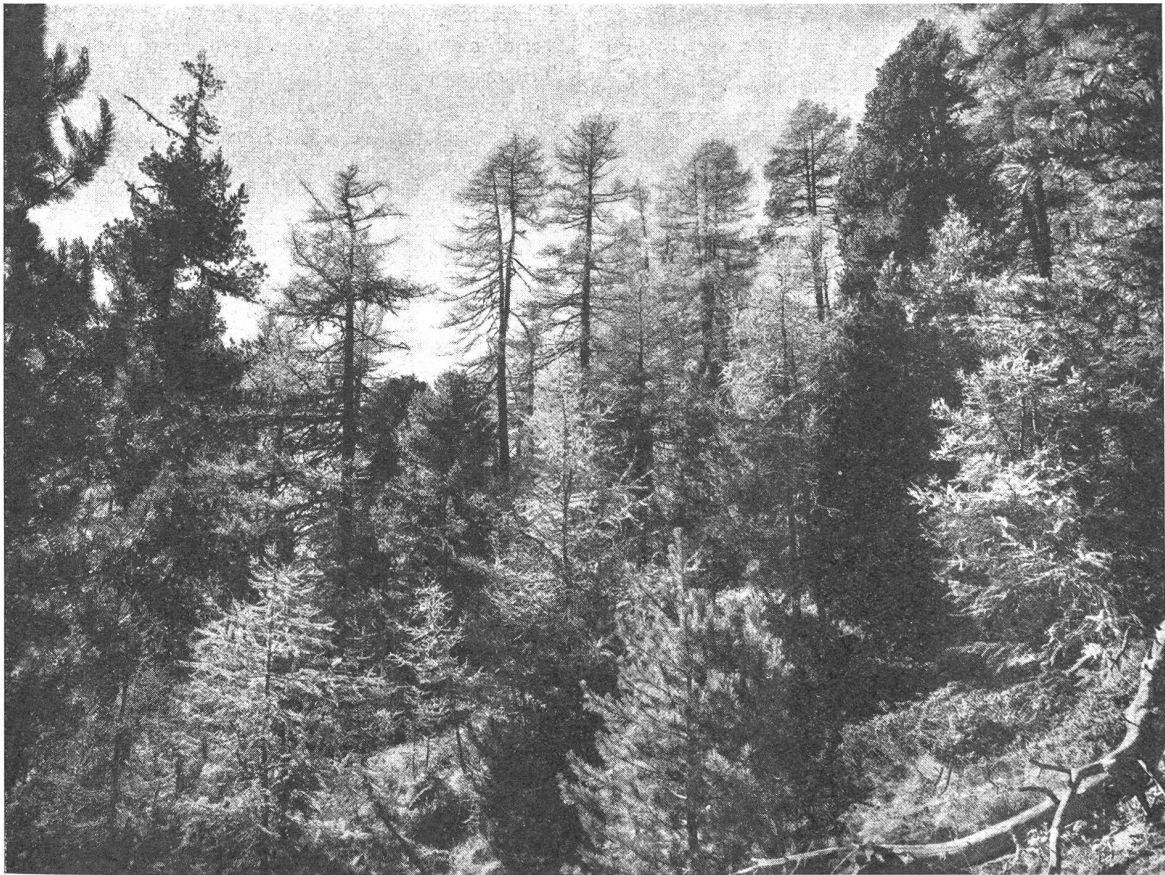
Bild 5: Arven- und Lärchenwald zwischen St. Moritz und Pontresina.

Coaz sah bereits 1894 den Waldbestand des Oberengadins schwer bedroht und sagte ihm, hauptsächlich auf der Sonnenseite des Tales, wo der Wickler