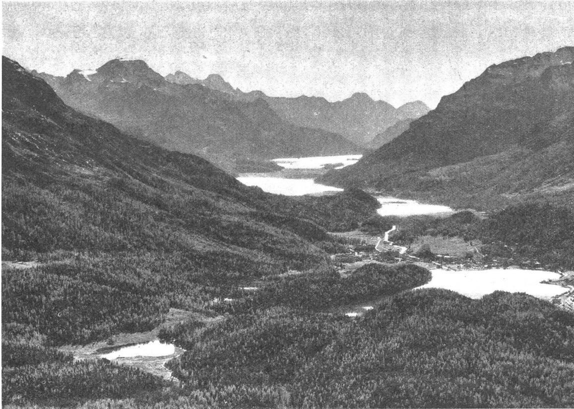
Bild 2: Die Seen des Oberengadins, gesäumt von Lärchen- und Arvenwäldern, im Glanze der Herbstsonne.

Die ältesten Angaben über eine Rotfärbung der Lärchenwälder im Alpengebiet findet sich vermutlich in einer Tagebucheintragung des Forstrates Davall vom 10. Juli 1820, der auf einer Fahrt durchs Wallis bei Ardon den ersten geschlossenen Lärchenbestand sah und sich von seinem einheimischen Reiseführer sagen ließ, daß die Rotfärbung der Bäume durch eine in diesem Jahre erstmals aufgetretene Erkrankung hervorgerufen werde. Eine ähnliche Beobachtung findet sich in einem Reisebericht von D. S. Brunner , der im Jahrbuch des Schweizerischen Alpen-Clubs, Jahrgang 1927, wiedergegeben ist, worin der Verfasser erzählt, wie er beim Übergang über den Lötschenpaß ins Lötschentale am 27. Juli 1829 feststellte, daß die Lärchenwälder des Lötschentales verdorrt und fuchsrot aussahen, so daß sie «gegen den gewöhnlichen fröhlichen Eindruck, den sonst das helle Grün der Lärchtanne auf das Gemüt zu machen pflegt, sehr traurig abstachen».