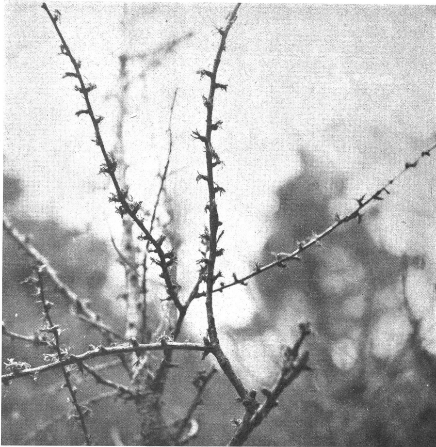
Bild 1: Vom Lärchenwickler befallene Zweige. Von den Nadelbüscheln bleiben nur noch rötliche Stummel übrig, an denen feine Seidenfäden hängen.

In Tages- und Fachschriften war in letzter Zeit oft die Rede vom Auftreten des Lärchenwicklers in der Schweiz. Er wurde im Wallis, im Tessin, in Uri und Graubünden festgestellt. Seit rund hundert Jahren wird dieses Auftreten, das nach einigen Jahren unbedeutender Schädigung zu einer Massenvermehrung führt, die nach drei Jahren jäh abbricht, aufmerksam verfolgt. Verschiedenen Maßnahmen zu seiner Bekämpfung blieb der Erfolg versagt. Erstmals in diesem Jahr kamen neuartige Bekämpfungsmittel zur Anwendung. Vielleicht ist damit der Weg zu einer erfolgreichen Abwehr gefunden und die Gefährdung der Lärchenwälder des Oberengadins vorbei. Eine Reihe biologischer Probleme, den kleinen grauen Falter betreffend, konnten bisher von der Wissenschaft noch nicht gelöst werden.