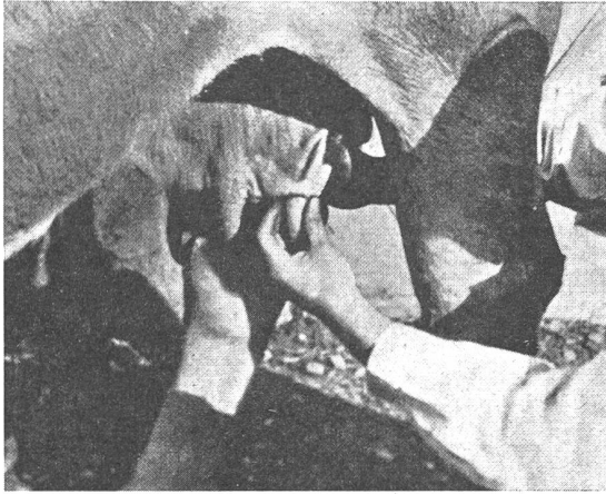
Bild 2: Infolge Erkrankung stark zurückgebildetes, geschrumpftes Euter, das nur noch wenig und stark verändertes Sekret lieferte.

erreger zu befreien und damit die Seuche zum Erlöschen zu bringen. Leider konnte mit den bisherigen Arzneimitteln und Behandlungsmethoden dieses Ziel nicht in einer befriedigenden und wirtschaftlich tragbaren Weise erreicht werden.