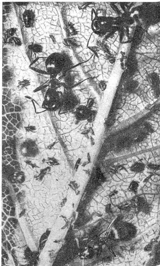
Ameisen holen Blattlausnektar

kommt es bald zu einem Gleichgewicht zwischen Vermehrung und Abgang, und eine Bekämpfung durch den Menschen ist gar nicht mehr nötig. Wenn jetzt noch eine der