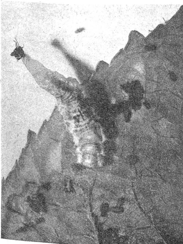
Larve einer Schwebfliege beim Aussaugen einer Blattlaus

räuberischen Schwebfliegen mit wespenähnlichem, schwarz und gelb geringeltem Hinterleib ein Ei an den Zweig legt, ist das Schicksal der Blattlauskolonie besiegelt. Aus diesem Ei schlüpft nämlich eine fußlose Made, die mit unerwarteter Behendigkeit auf den Blättern herumkriecht und mit ihrem spitz zulaufenden Vorderende nach allen Sei-