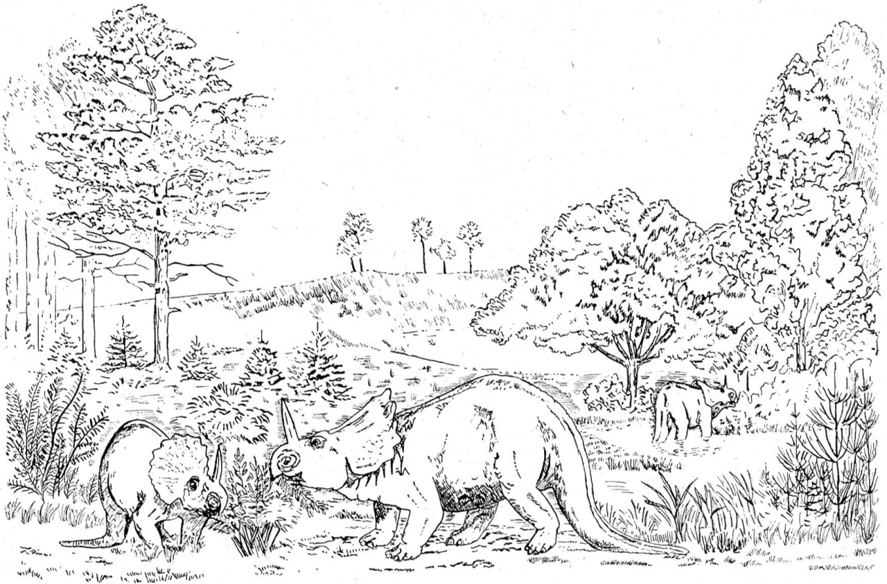
Drei Horngesichtsaurier ( Monoclonius nasicornus ) in einer Landschaft der oberen Kreidezeit (rekonstr. von R. Deckert)

Natürlich gibt es noch Saurier. Die Eidechsen nämlich und die Leguane, die Varane, die Blindschleichen und Ringellechsen ebenso wie die berühmte Brückenechse werden zoologisch unter die Saurier gezählt. In weiterem Sinne könnte man auch die Krokodile zu den Sauriern rechnen, denn die Namen vieler fossiler Glieder dieser Ordnung endigen auf -saurus.