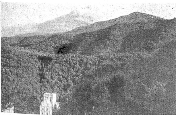
Die Hügel der Halbinsel Athos sind noch heute dicht bewaldet, denn jedem weiblichen Wesen, also auch Ziegen und Schafen, ist der Zutritt versagt

Der menschliche Einfluß ist ein weiterer ausschlaggebender Faktor in der Gestaltung der Pflanzendecke. So war man zwar früher der Meinung, der spärliche Pflanzenwuchs weiter Strecken der Mittelmeerländer sei eine Folge des Klimas, der Trockenheit des Bodens und der großen Hitze im Sommer, hat aber jetzt längst erkannt, daß der Mensch diese Waldlosigkeit durch seine Holzeinschläge und durch das Halten zahlloser Schafe und Ziegen, die in ihrem Weidegebiet kein Gehölz hochkommen lassen, verschuldet hat. Das Vieh vernichtet darüber hinaus mit der Zeit die schützende Pflanzendecke, sobald der Wald geschlagen und zur Weide freigegeben ist, so daß schließlich eine Wüste zurückbleibt, deren Humus die