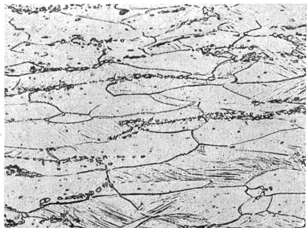
Durch Kaltwalzen verformter weicher Bandstahl. Man erkennt in den durch das Walzen langgestreckten Eisenkristallen vereinzelt Stränge von kleinen Karbidteilchen, sowie in einzelnen Kristallen die durch die Verformung entstandenen Gleitlinien (etwa fünfhundertfach vergrößert)

Unabsehbar sind die zahllosen Kombinationen von Legierungselementen, die einzelne Eigenschaften der Stähle verändern. Durch Legierung mit Nickel und Mangan, oder aber mit Chrom und Wolfram kann man das Eisen für elektrische Maschinenteile völlig unmagnetisch machen oder in Dauermagneten die Magnetisierbarkeit auf über den dreihundertfachen Wert des reinen Eisens steigern. Man kann die Wärmeausdehnung durch hohe Nik-