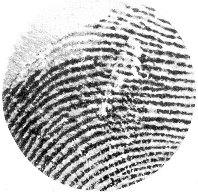
Abdruck eines Daumens, bei dem unter dem Mikroskop zu sehen ist, daß ein Hautstückchen fehlt

Wie selbst einzelne Staubpartikelchen den Schlüssel zu einem kriminalistischen Problem bieten können, zeigte sich erst kürzlich wieder, als man in einer Falschmünzerei-affäre einen Verdächtigen aufgriff. Die Detektive bürsteten seine Kleider aus; im sorgfältig gesammelten Staub fanden sie genug Metallteilchen, um ihm nicht nur nachzuweisen, daß er falsche Angaben über seinen Beruf