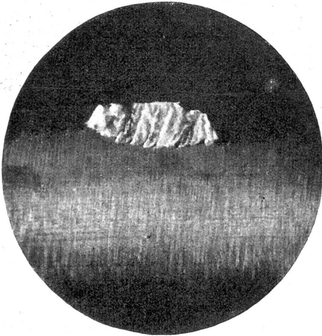
Rasiermesser, auf dem unter dem Mikroskop ein Hautfetzchen zu erkennen ist

Jeder hat wohl schon von einem Mord gehört, bei dem niemand den Übeltäter beobachtete, niemand ihn vom Tatort fliehen sah, auch kein Zeuge den Angeschuldigten in der Gesellschaft des Opfers oder das Mordwerkzeug in seiner Hand bemerkte und es dennoch der Polizei gelang, dem Angeschuldigten seine Tat mit Hilfe von nur ein paar Härchen, ein wenig Schmutz, einem kleinen Flecken oder einer andern Spur nachzuweisen.