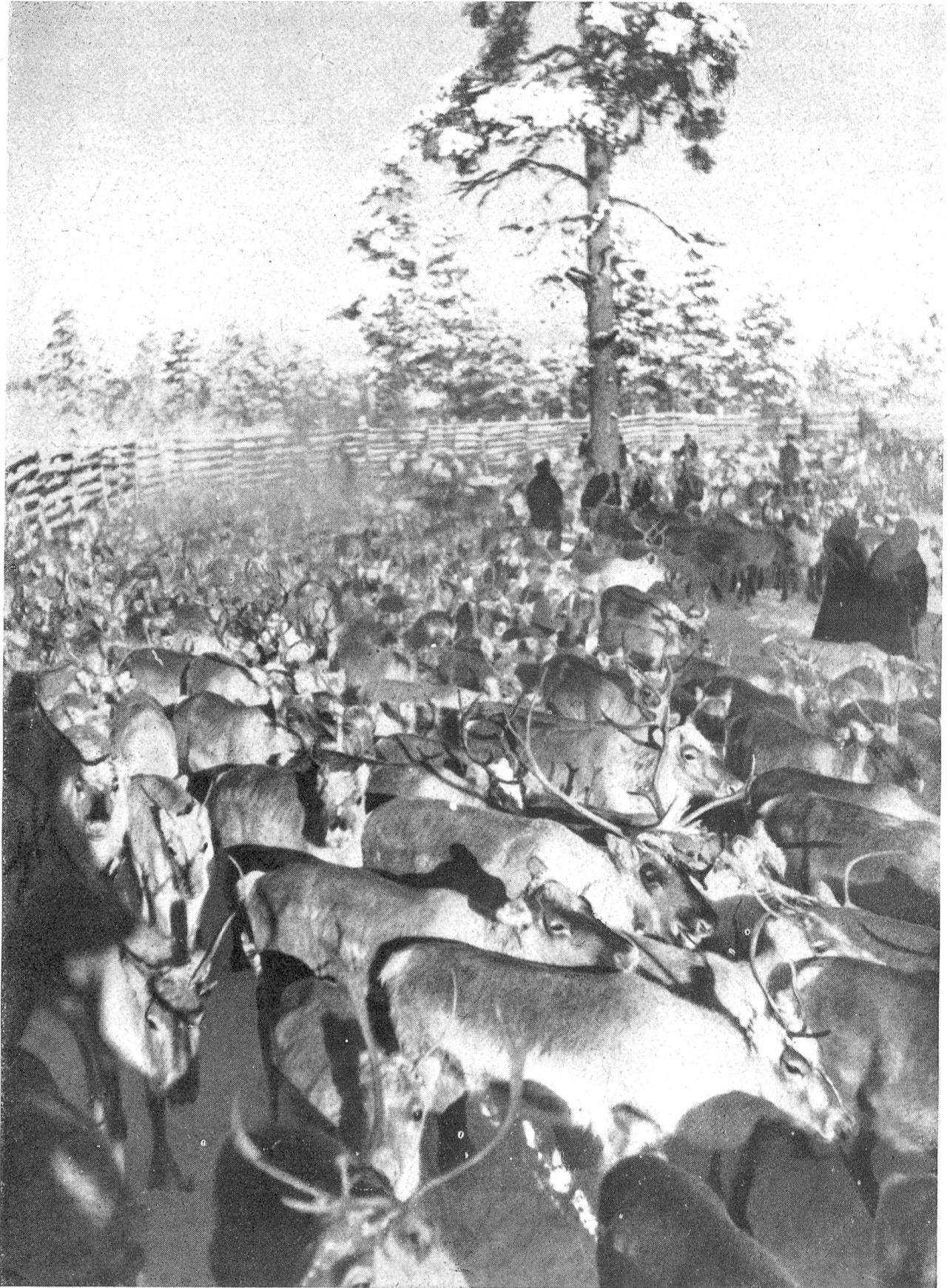
Reine sind zum Markieren zusammengetrieben worden