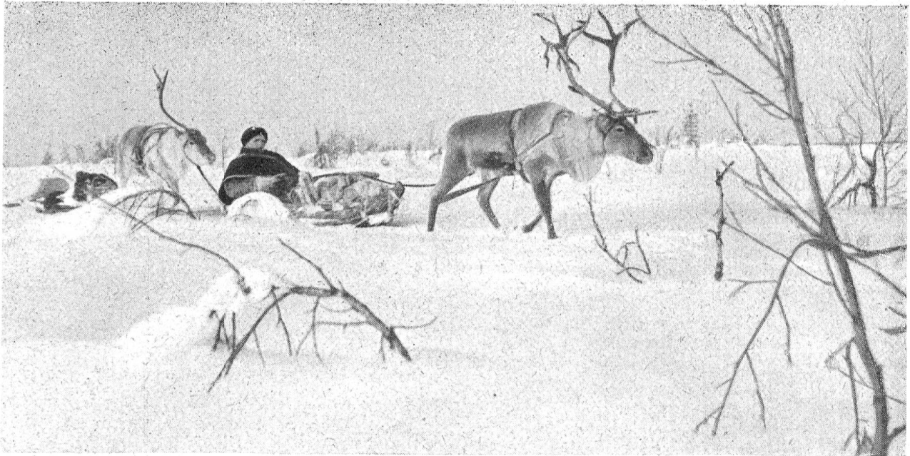
Reise in der Pulkka

klettert es gemsenflink, gleichsam wie auf Steigeisen, steile Geröllhänge hoch und schreitet sicher auf glattem Gletschereis. Seine Läufe sind derart gelenkig, daß es sich zum Beispiel der hinteren als „Hände“ bedienen kann, so wenn es lästige Bastfetzen am Geweih abstreift, sich am Vorderrumpf kratzt oder Eis am Windfang beseitigt.