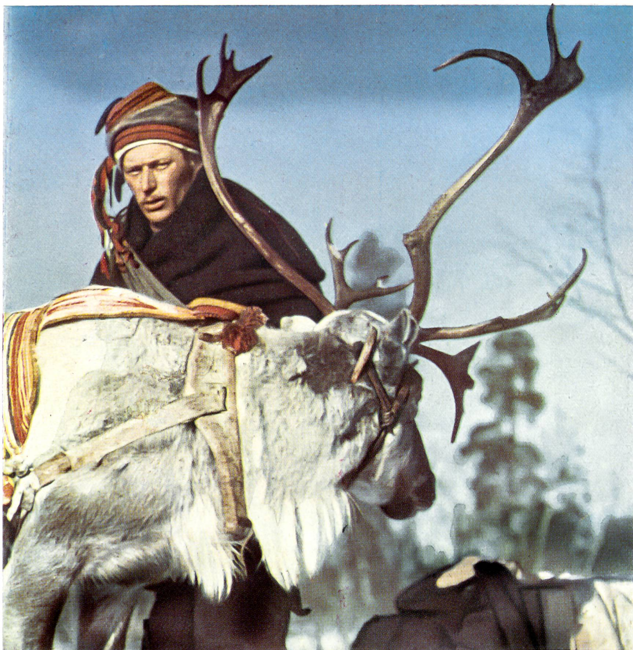
Ein Raito-Führer. „Raito“ heißt eine Karawane von Ren-Schlitten in der Lappland

so gut wie unentbehrlich. Der Pelz verliert nämlich sehr schnell die Haare, die überdies mit Ausnahme derjenigen an Kopf und Läufen, aus deren Fell man vor allem Schuhwerk macht, sehr leicht brechen. Die starke Haut gibt dagegen ein ganz ausgezeichnetes Wildleder ab, das schon seit einiger Zeit große wirtschaftliche Bedeutung erlangt hat.