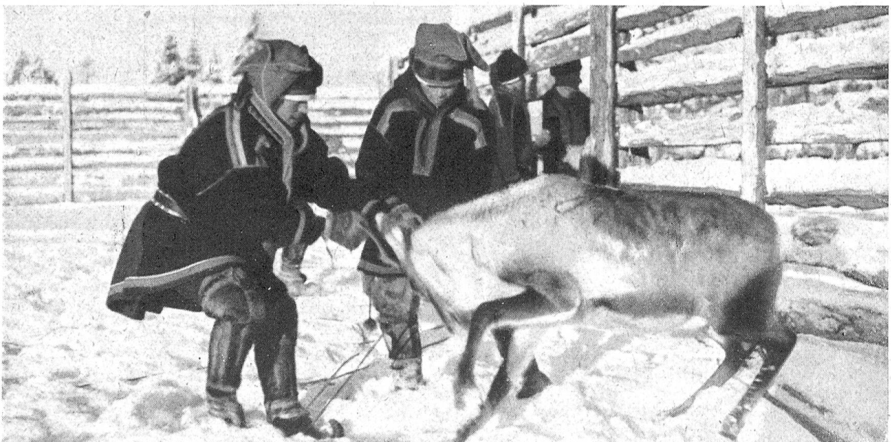
Lappen markieren ein Ren

weiten Wanderungen über die wüstenartigen schneeüberzogenen Tundren vor ihre bootartigen „pulkka“ oder „akja“ genannten Schlitten. Diesen Polarmenschen bietet das Ren alles, was sie benötigen: Felle zur unerläßlichen Pelzkleidung, zum Zeltbau und für die Schlafplätze, Fleisch und Milch. Daher sind die Herden der Zahmrene ihren Besitzern das kostbarste, oft das einzige Vermögen. Die reichsten Lappen haben Herden, die zweitausend, zuweilen auch etliche Tausend mehr zählen. Nur sie selbst wissen genau, wieviel Rene sie ihr eigen nennen, nicht