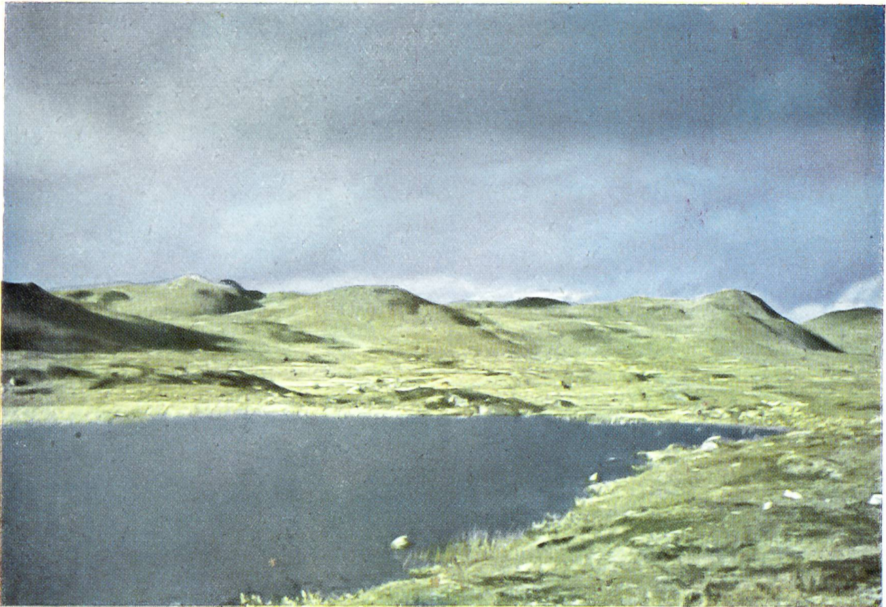
Diese großartig-monotone Tundren-Landschaft des hohen Nordens ist die Heimat der Rene

Bei diesen Herden können sowohl männliche als auch weibliche Rene als Leittiere fungieren; wahrscheinlich überwiegen dabei sogar die Ren-„Kühe“.