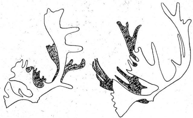
Geweihsformen von Renen. Links: Der nordamerikanische Koribu, rechts: Die Art Rangifer arcticus von Labrador

Keine noch so tiefe Temperatur, kein noch so eisiger Sturm, der über die deckungslosen Tundren oder über die