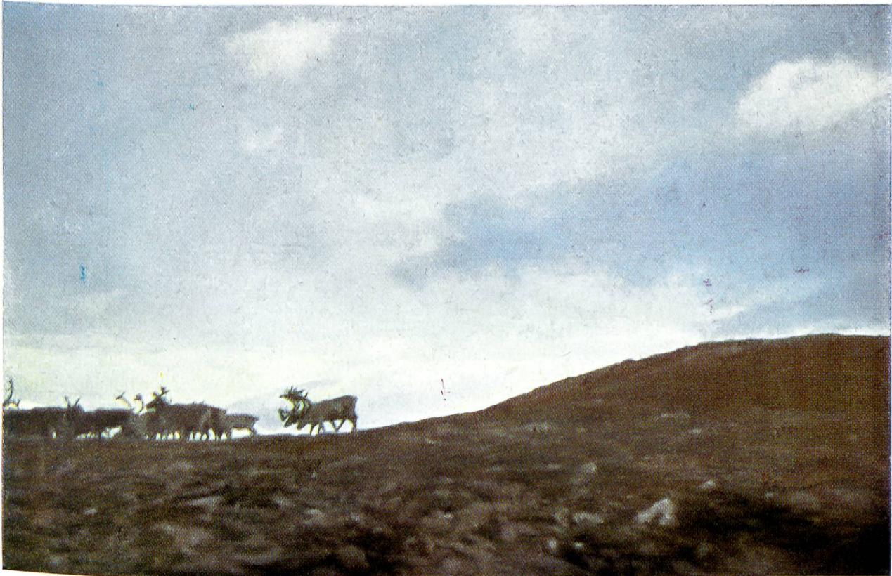
Über die unendliche Weite des Nordens zieht eine Herde Wild-Rene

Das Ren oder Rentier, als zoologische Gattung „Rangifer“ genannt, gehört zu den für die hochnordische Landschaft besonders charakteristischen Tieren. Seine eigenartigen Merkmale und nicht zuletzt die hochentwickelte Form seines Gemeinschaftslebens machen es zu einem außerordentlich interessanten Tier. Für die meisten in der Arktis und Sub-Arktis beheimateten Völker bildete diese Hirschart sogar die Grundlage ihrer Existenz. Das Ren wurde daher schon sehr früh gezähmt und gezüchtet. Es ist der einzige vom Menschen als „Haustier“ gehaltene Hirsch. Jedoch ist der Begriff Haustier hier mit einer gewissen Einschränkung zu verstehen; auch das in Heiden gehaltene Ren ist im Grunde immer noch halbwild.