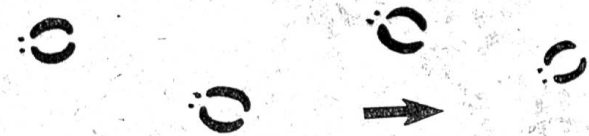
Fährte des Rentieres

baumlosen skandinavischen Hochflächen, die Fjelle, rast, lassen die beißende winterliche Kälte an den Renkörper selbst heran. Der überaus dichte Pelz aus langen, in sich gewellten luftgefüllten Grannenhaaren – eigentlich sind es am Ende stärkere Röhrchen, die wieder Luft haltende Zwischenräume bilden – schützt es in idealer Weise. Daher ist es auch ein vorzüglicher und recht schneller Schwimmer; weder reißende Stromschnellen, weite Strecken, noch auch