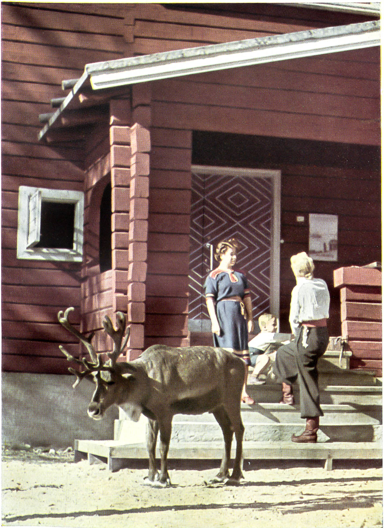
Ein zahmes Ren vor dem Inari-Rastbaus in Finnisch-Lapland