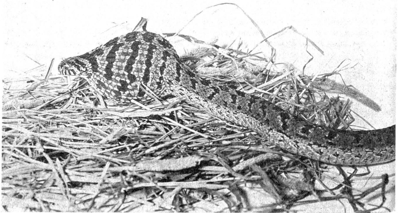
Der Leib der Schlange ist in der Schlundgegend unförmig aufgetrieben, bevor die eierbrechenden Zähnnchen der Wirbel in Funktion treten

Tätigkeit, welche unter allen Tieren nur diese eierfressende Schlange besitzt: Die Fortsätze der Wirbel funktionieren als Eierbrecher, d. h. durch Zusammenziehen der Backenmuskulatur werden kleine Brechzähnnchen in die Eischale gedrückt, so daß der Inhalt in den Magen ausläuft, wo er verdaut werden kann. Die leere Schale wird an einem Stück wieder durch den Mund ausgewürgt.