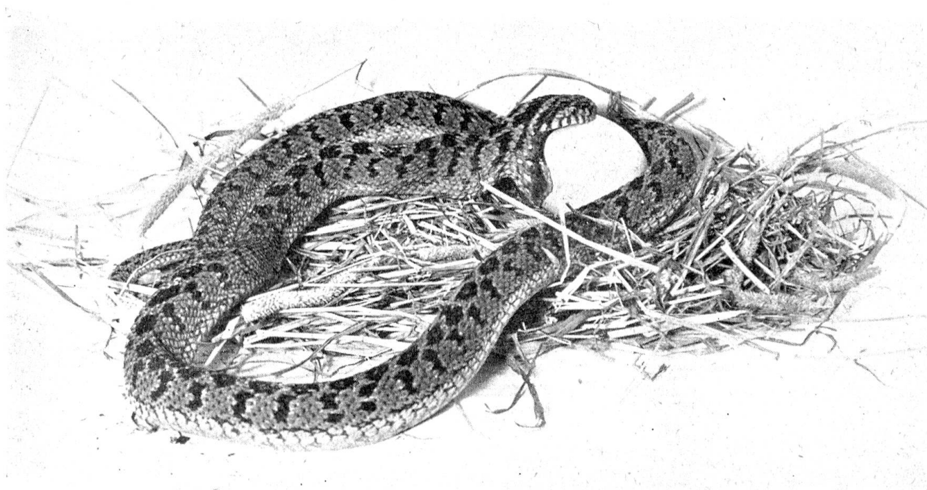
Die eierfressende Schlange hat begonnen, ihre Kiefer über das Ei zu stülpen

weit aufsperrn, soweit, daß die Kiefer einen Winkel von 130° bilden, während z. B. der Mensch nur eine Bewegung von 30° in seinem Kiefergelenk auszuführen imstande ist. Die Muskulatur und Haut des Nackens und Schlundes läßt sich dabei dehnen wie Gummi und langsam, so wie man einen Kissenüberzug über ein Kissen stülpt, schieben sich ihre Kiefer über das Ei. Der unförmig erscheinende Kopf verliert dabei jede Tierähnlichkeit und der Beschauer fragt sich unwillkürlich, wie die Schlange wohl aussehen werde, wenn sie ihre Mahlzeit beendet hat. Sobald aber das Ei in den Schlund befördert worden ist, tritt eine Einrichtung in