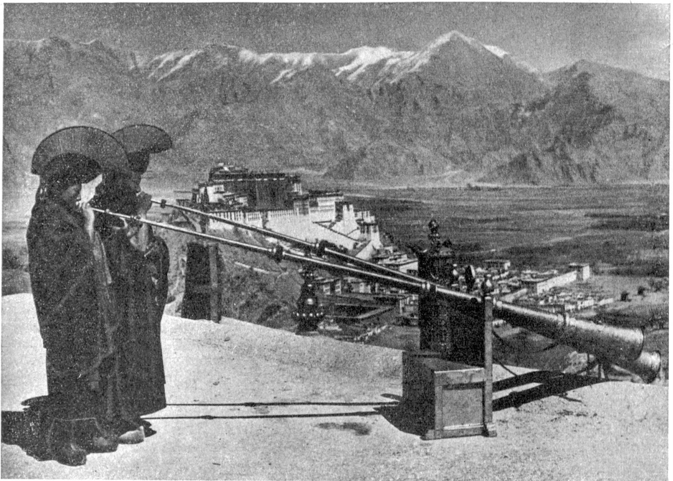
Einblasen des Neujahrfestes in Lhasa

Da erfaßt uns plötzlich eine seltsame Erregung. Als wenn der Buddha unsere Augen lenkte, fallen wir in Galopp und jagen — halb unbewußt — über Stock, Stein und kiesiges Geröll der nächsten Bodenwelle entgegen. In jubelnder Begeisterung wird die kleine Anhöhe erklimmen. Und dann — — — wahrhaftig! Da wächst sonnfunkelnd auf hochwuchtem Zeugenfels das Wahrzeichen Lhasas, der Potala, der wunderbare, der goldstrahlende Palast der Gottkönige von Tibet, aus blaudunstverschleierter Ebene hervor! Dies Monument des Glaubens, Sinnbild einer endgültigen Macht mitten in felsstarrender ungebändigter Natur, zwingt uns augenblicklich von den Pferden. In tiefem Schweigen stehen wir versunken. Alle steinerne Monumentalität scheint zu versinken. Der Potala ist atemberaubende, ist fehlerlose gesteigerte Idee. Die Kraft des Glaubens und eine überschäumende Phantasie haben dieses