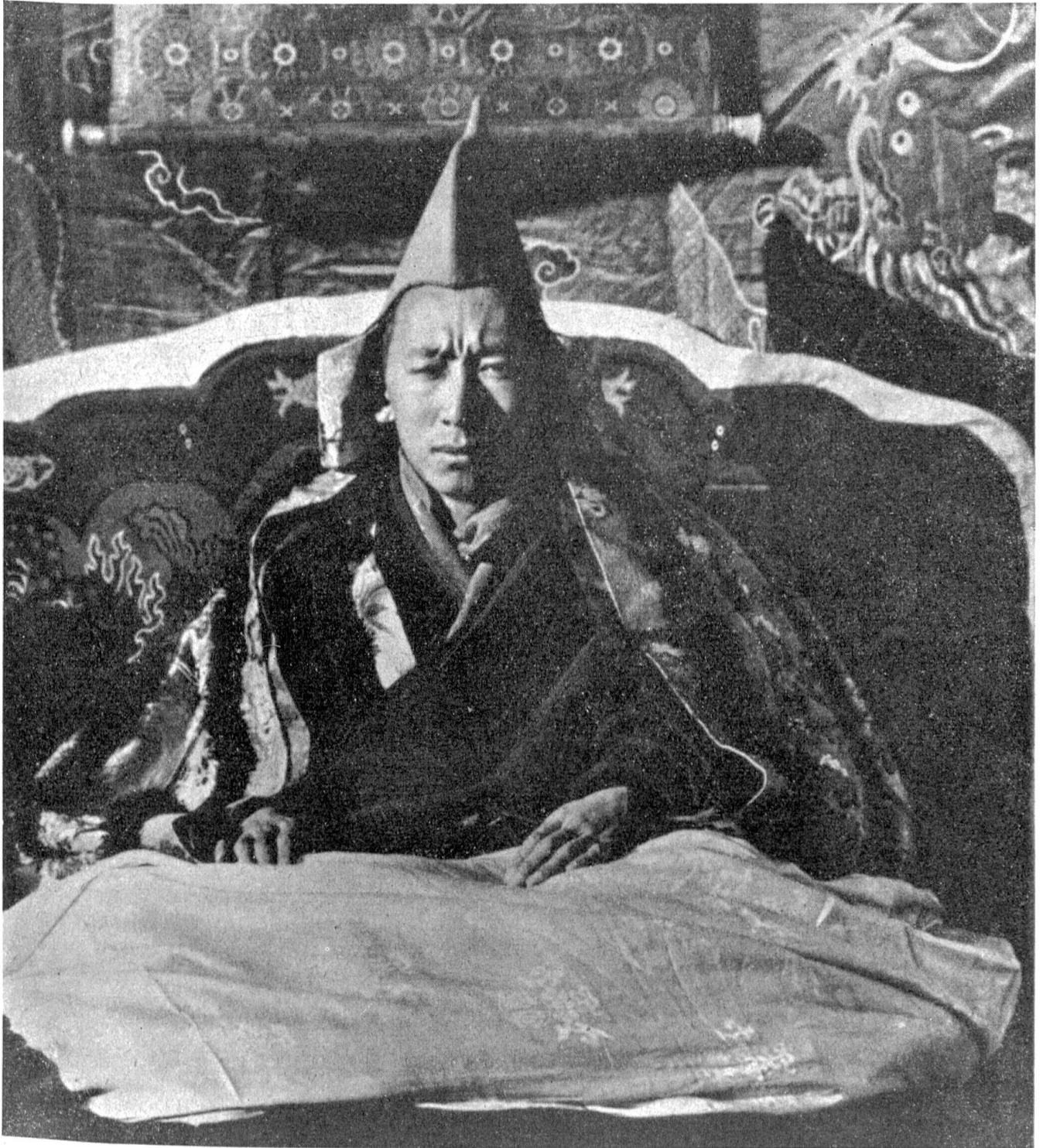
Gyalpo Chutuktu Reting Rimpoché, der Herrscher und Regent Tibets

Das ist der Potala, ein bis zum blauen Firmamente aufragender Berg eines Gebäudes, in Stein gedachter Gedanke, titanische Persönlichkeit. Macht und Erfüllung jener uralten Prophezeiung: „So wird ein von Freude erfülltes Kloster das Schneeland sein.“