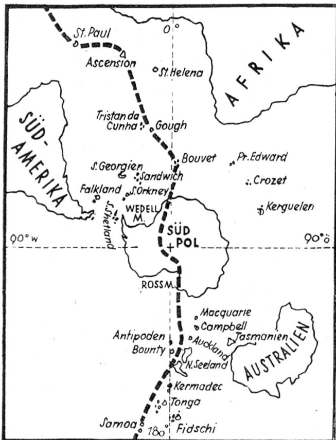
Die vermutete geologische Bruchlinie, die als Fortsetzung vorhandener Inseln durch den Südpolarkontinent ziehen würde

Zu lösen ist nur noch das Problem, ob dieses Festland der Antarktis geologisch und morphologisch einheitlich gebaut oder aus geologisch und morphologisch verschiedenen Teilen zusammengesetzt ist. Die Andenkette Südamerikas setzt sich vom Feuerland in einem geschwungenen Doppelbogen über die Falkland-Inseln, Süd-Georgien, südlichen Sandwich-, südlichen Orkney-Inseln in den südlichen Shetlands und im Graham-Land fort, das schon kartographisch die gleiche Rüsselform aufweist wie die Südspitze Südamerikas. In beiden treten auch Vulkane auf. 90 Grad östlich davon scheint sich die südasiatisch-westpazifische Faltengebirgs- und Vulkanreihe: Sunda-Inseln—Neuguinea—Salomonen—Hebriden—Neukaledonien—Fidschi-, Tonga- und Kermadec-Inseln—Neu-Seeland, Antipoden-, Macquarie- und Balleny-Inseln auf