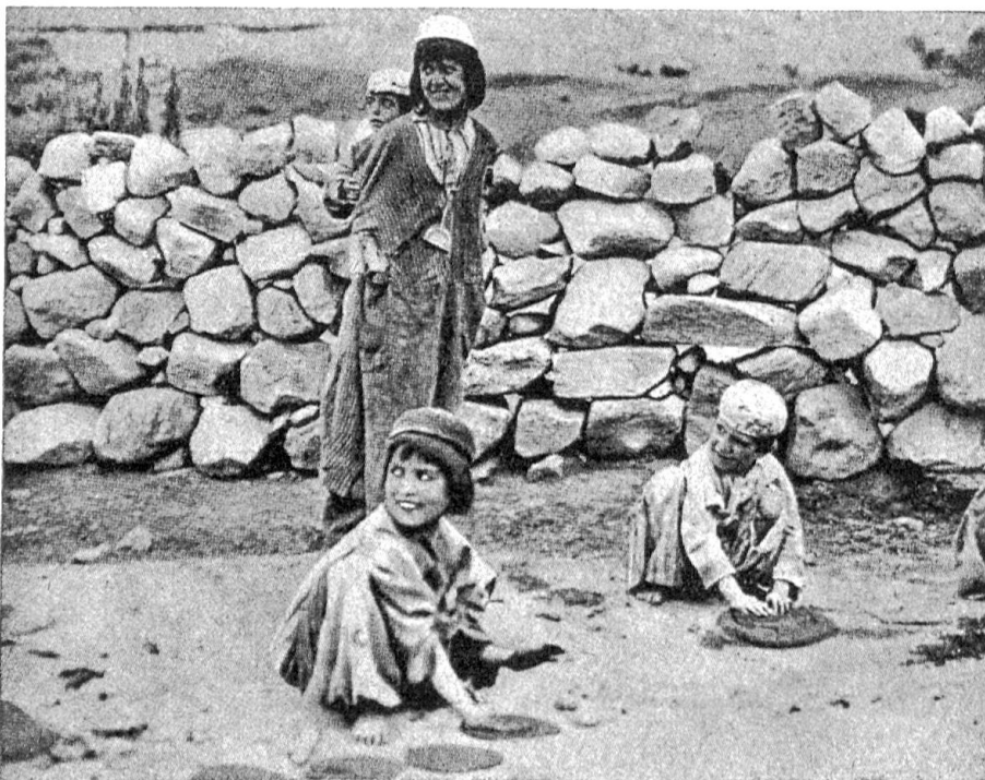
Abb. 5. Selbst am Ende der langen und harten Fastenperiode, wie sie jeder Winter mit sich bringt, sind die Menschen des Hunsalandes noch vergnügt und lebenswürdig, wenn auch abgezehrt und von Sehnsucht nach Brot erfüllt. In der Vorfreude auf die Köstlichkeit, die es erst wieder gibt, wenn das Korn reif geworden ist, formen die Kinder hier Brot aus Erde und Wasser

Aber keine der unzähligen chronischen Krankheiten, die bei uns namentlich im mittleren Alter gewöhnlich sind, scheinen im Hunsavolk vorzukommen. Der bei uns meistens tödlich verlaufende Milzbrand führt dort nur zu einem unschuldigen kleinen Karbunkel. „Die Leute von Hunsas werden außerordentlich alt und ihr Hinscheiden erfolgt ohne Schmerzen in heiterem Frieden“ (McCarrison). „Life“ (28. 1. 1950) veröffentlichte das Bild eines 99jährigen Hunsamannes, der, von der Bartfarbe abgesehen, einem 30jährigen jungen Manne gleicht. Lorimer traf eine ältere Frau, die einen jährigen Knaben an der eigenen Brust stillte. „Du bist wohl seine Großmutter?“ — „Nein, ich bin seine Urgroßmutter, und sieh, wie er gut gedeiht, ich habe ihn allein aufgezogen!“ Hunsaträger bei Karakorumexpeditionen hatten am Abend, nachdem die übrigen Teilnehmer von den Strapazen erschöpft