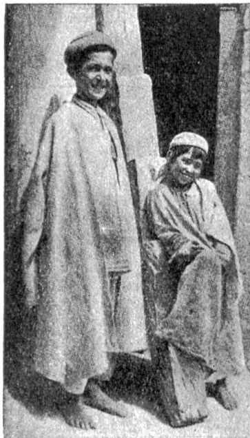
Links: Abb. 2. Im Gegensatz zu allen Völkerschaften der Umgebung ist der Menschentyp der Hunsä fast rein europäisch zu nennen

Das Hunsävolk hat sich durch genau eingehaltene Heiratsregeln sehr rein erhalten. Es sieht so europäisch, wohlgebaut und kultiviert aus (Abb. 2), daß seine Angehörigen, in europäische Kleider gesteckt, nicht auffallen würden, wenn sie unter uns gingen. Die Inneneinrichtung der Hunsähäuser im ältesten