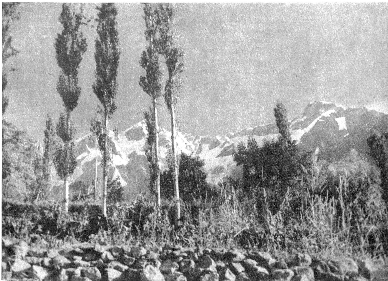
Abb. 4. Das Hunsaland liegt am Südrande des „Daches der Welt“, des gewaltigen Pamir-Gebirges. Blick auf die eisbedeckten Berggipfel aus dem Garten des Königs von Hunsala

Wie fanatisch und abergläubisch die umliegenden Völkerschaften in ihrer Religion sind, ist kaum zu sagen. Entsetzliche Angst vor dem „bösen Auge“, viele strenge „Tabus“, grausame Riten und das eifrige, unermüdliche Drehen möglichst vieler „Gebetsmühlen“ vergällen diesen Menschen das Leben. Im Hunsaland ein ganz anderes Bild: die Religiosität tritt kaum in Erscheinung, aber durchdringt das Leben dennoch. „Ungläubig sind sie auf keinen Fall“, schreibt Lorimer, obwohl ihm die Verborgenheit der religiösen Formen und das Fehlen von Aberglauben auffiel. „Sie sind getragen von einem unbedingten Glauben an einen guten, freundlichen Gott, dessen Wege sie nicht zu verstehen vorgeben... Es ist selbstverständlich für sie, daß Gott von ihnen Arbeitsfleiß, guten Willen und Aufrichtigkeit verlangt. Sie arbeiten darum zäh und hurtig, ohne von anderen ebensoviel zu verlangen, und sind freundlich zu jedermann, der es recht meint, mild zu Kindern und Greisen, über alles Maß großmütig gegenüber Waisen, und besorgen ihr Tagewerk mit einem beglückenden Ver-