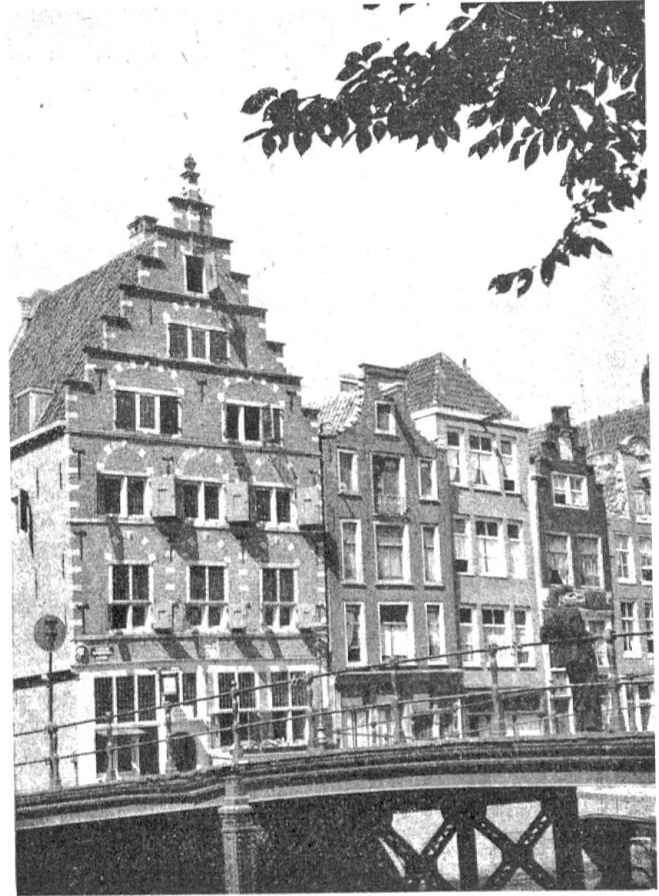
Diese kleine holländische Insel spielt für den westindischen Flugverkehr die gleiche Rolle wie etwa Batavia für die Insulinde. Von hier aus

Wenige Stunden später geht der Flug weiter, wieder über die unendlich scheinende Fläche des Ozeans, nach Süden. So interessant und abwechslungsreich die Ostindienstrecke ist, die Westindienroute führt zu 90% über die eintönige, ewig gleichbleibende Wasserfläche, die nur ab und zu von einem Schiff durchpflügt wird. Der Kurs führt über den Ostteil der Insel Haiti, das alte Hispanola, rechts unten liegt Ciudad Trujillo und dann folgt die Weite der Karibischen See, bis das Ziel dieser Flugreise, Curaçao mit seiner Hauptstadt Willemstad (Abb. 9), erreicht ist.