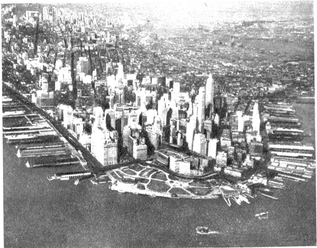
Abb. 8. New York! Im Vordergrund die Wolkenkratzer des Geschäftsviertels, links der North River und rechts der East River, die Man- hattan von Brooklyn und Queens trennen