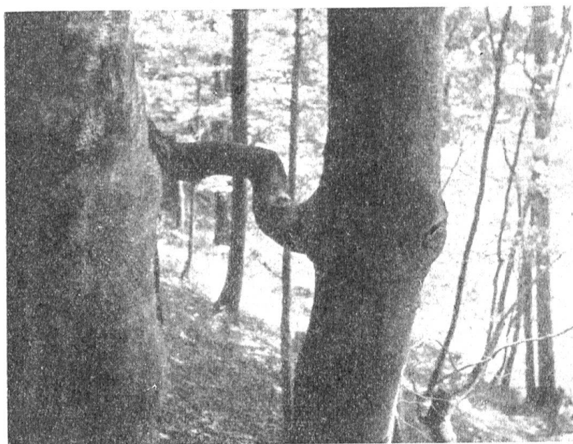
Abb. 3. Zwei Buchen sind durch einen gemeinsamen Ast von etwa 8 cm Stärke miteinander verbunden

Man steht lange vor solchen Ver- wachungserscheinungen und ver- sucht umsonst die Frage zu klären, wie sie zustande gekommen sein mögen. Daß Bäume, die sehr enge