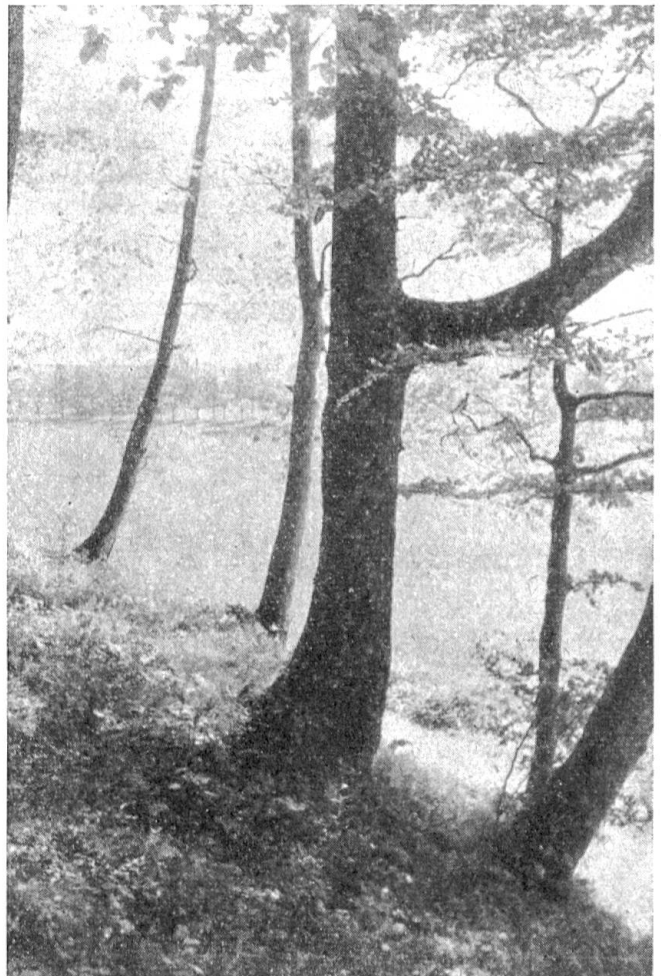
Abb. 1. Der Stamm einer Fichte hat in ganz ungewöhnlicher Weise einen mächtigen Seitenast entwickelt, der als zweiter Hauptsproß eine zweite Baumkrone entwickelt hat. (Auf dem Bilde ist nur die in etwa 1,5 m Höhe über dem Boden liegende Verzweigungsstelle sichtbar)

Unser eingangs erwähnter Wald bietet auch dafür Beispiele. Interessanter aber ist die dort ebenfalls zu beobachtende Erscheinung, daß zwei Bäume, welche ziemlich weit voneinander entfernt stehen, dennoch zu einem einzigen Stamm zusammengewachsen sind. In Abb. 2 ist ein solches Exemplar einer Buche zu sehen, bei der in der Höhe von etwa 1 m über dem Boden zwei kräftige Stämme sich zu einem einzigen, schön rund ausgebildeten Haupt-