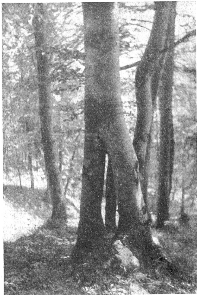
Abb. 2. Zwei Buchenstämme haben sich etwa 120 cm über dem Boden zu einem einzigen Stamm vereinigt (Bilder nach Aufnahmen des Verfassers)

stamm mit nur einer einzigen Baumkrone zusammengeschlossen haben. Obzwar es sich in Bodennähe um zwei ganz deutlich voneinander entfernt und getrennt stehende Stämme handelt, ist es dem oberen Teil des Baumes nicht anzu- sehen, daß er aus zwei Stämmen mit zwei ver- schiedenen Wurzelsystemen aufwächst.