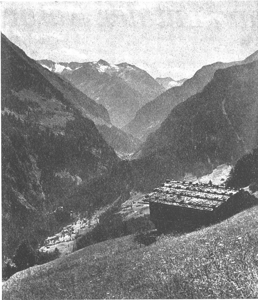
Abb. 2. Jede Lichtung des hochgelegenen Gebirgswaldes bringt neue Gefahren für die Siedlungen der Alpentäler. Im Gebiet des inneren Zillertales, das unser Bild zeigt, gingen im vergangenen Winter schwere Lawinen ab