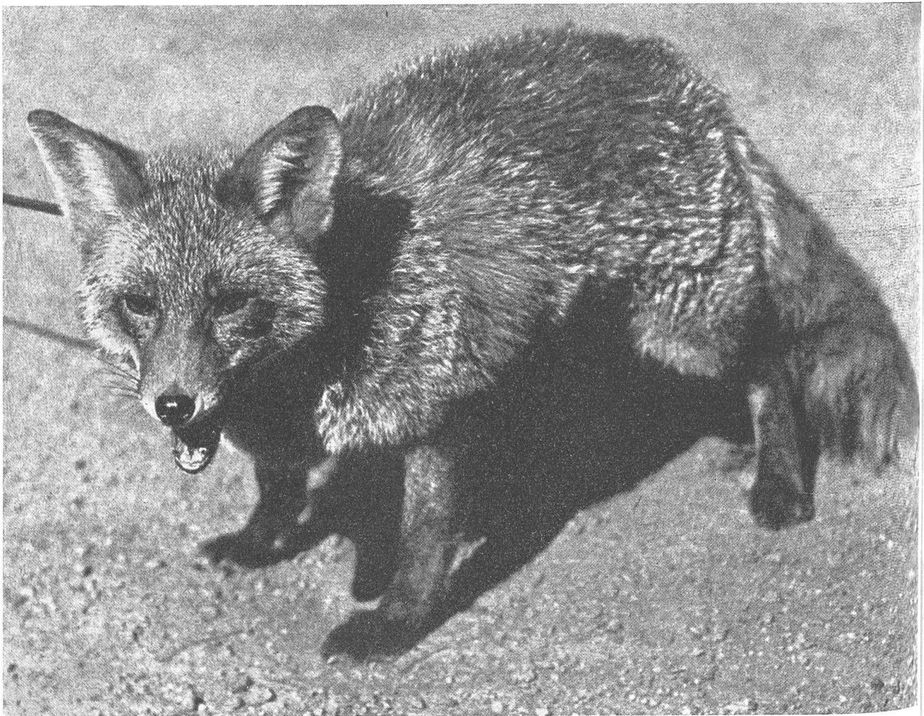
Abb. 3. Bereits selbständig geworden! Junger Rotfuchs

Eine Eigenschaft des Fuchses, die stark zur Geltung kommt, ist dessen Mißtrauen gegenüber allem Neuen und Ungewohnten. Jede