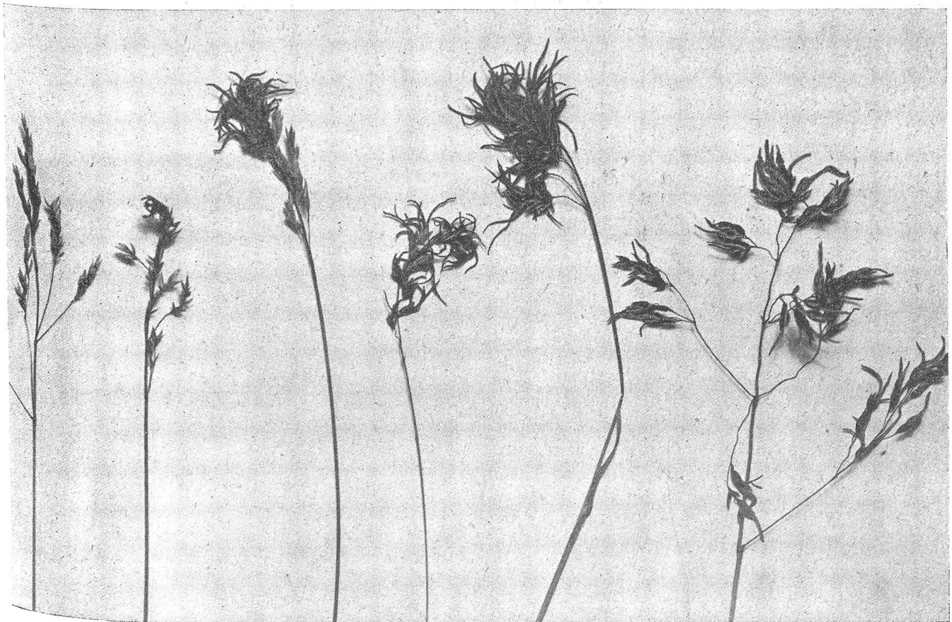
Abb. 2. Gemischte Blütenstände des lebendgebärenden Knöterichs. Unten Bulbillen, oben Blüten

noch eine Kältebeeinflussung nötig ist. Er machte seine Untersuchungen an Poa alpina , und zwar an Pflanzen, die zum Teil aus den Schweizer Alpen, zum anderen Teil aus Grönland stammten. Er stellte fest, daß das lebendgebärende Alpenrispengras mit Leichtigkeit auch im Flachland in Töpfen kultiviert werden kann und daß unter diesen Bedingungen die Pflanze alle 14 Tage ein neues Schoß treibt. Gewöhnliche solche Pflanzen ergeben bei allen Versuchen im Frühling und Vorsommer, solange die Tage noch kurz sind, immer nur Blüten. Während des Sommers sind die Pflanzen steril, und erst im Herbst, unter dem Einfluß der Kurztage entstehen wieder neue Blüten. Es entwickelten sich also in diesem Experiment überhaupt keine Bulbillen, trotzdem die Versuchspflanzen alle von solchen Exemplaren abstammten, welche im Sommer vorher sowohl in Grönland als in den Alpen richtige Brutzwiebeln hervorgebracht hatten. Wenn F. Schwarzenbach aber seine jungen, noch nicht blühenden Pflanzen während des Winters nicht im Gewächshaus hielt, sondern einer Kältebehandlung aussetzte (sogenannte Vernalisation), erhielt er ein völlig anderes Ergebnis: Vernalisierte (frostbehandelte) Pflanzen erzeugten im Frühling (Kurztageeinfluß) nur Blüten,