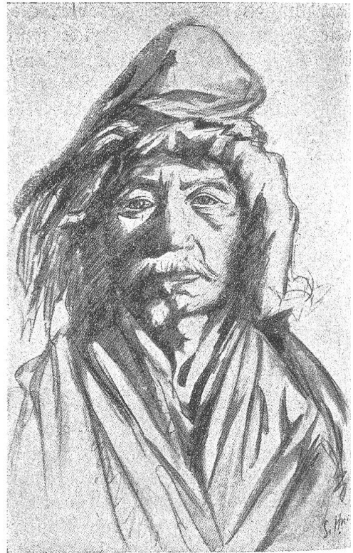
Rechts: Abb. 5. Der Oberlama in Tschunhul-gumpa (nach einer Skizze von Sven Hedin)

der benachbarten Kulturen, vor allem der indischen, erfahren hat und endlich im Lauf der Jahrhunderte in der buddhistischen Ideenwelt untergesunken ist (Bleichsteiner, Die gelbe Kirche). Die mit Räucherungen, betäubender Musik und mit mystischen Tänzen einhergehenden Beschwörungen von Krankheitsdämonen, die schließlich als Puppen verbrannt werden, die Verwendung von Menschenknochen zu Flöten und die von Totenschädeln zu Trinkgefäßen, Trommeln und ähnlichem und endlich die unzähligen Lokalgötter mit ihren Heiligtümern mit Tausenden von Menschenschädeln und Menschenhäuten haben ihren Ursprung im Schamanismus, in jener Religionsform, die auf der Vorstellung von dämonischen Geistern, Schattenseelen Verstorbener und Tiergeistern beruht. Ihre Priester, die Schamanen, suchen die Verbindung in ekstatischen Tänzen mit jener Geisterwelt zu erlangen. Zu diesem Schamanismus kommt dann noch eine ältere religiöse Schicht, der tibetische Volksglaube, der im übrigen manche Ähnlichkeiten mit jenem der Kaukasusstämme und der Alpenbevölkerung besitzt. Bekannte Motive, wie z. B. der Weltenbaum, Heischegänge der Kinder mit Schellen, Fackelzüge und Schwerttänze, Masken- und Mummenschanz, „Zottler“, Habergeiß und Schimmelreiter, Ahnen-, Frühlings- und Saafeste, Felderbegehungen, Gebildbrote und Zukunftsorakel u. a. m. finden Entsprechendes auch in der europäischen Volkskunde.