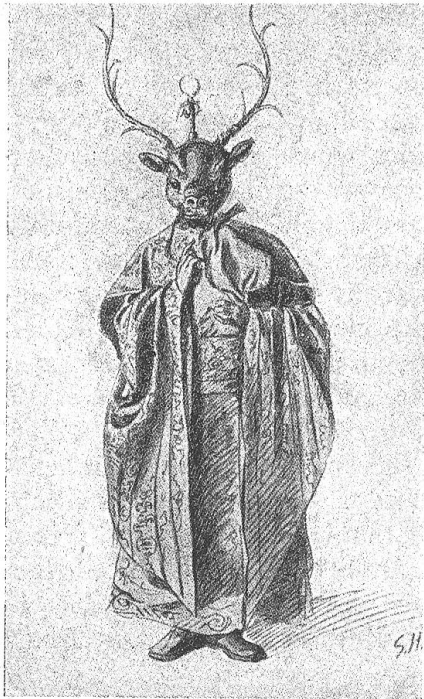
Links: Abb. 4. Ein Lama mit Tanzmaske (nach einer Skizze von Sven Hedin)

Die beiden Originalskizzen Sven Hedins sind, mit besonderer Genehmigung des E. Brockhaus-Verlages, dem Werk „Transhimalaya“ von Sven Hedin (1917) entnommen, das soeben in einer Neuauflage erschienen ist