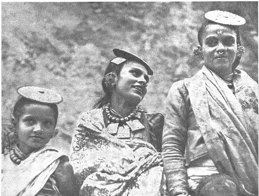
Abb. 3. Frauen aus Nepal in ihrer Volkstracht

All die unzähligen magischen Bräuche und Vorstellungen im Rahmen der gelben Kirche (Götter- und Dämonenglaube, Abwehrzauber, Maskenwesen, Tanzmysterien usw.) gehen auf ältere Glaubensformen zurück, die vor der Bekehrung Tibets zum Buddhismus hier in diesem Lande herrschten. Die einheimische vorbuddhistische Landesreligion, die sogenannte Bon-Religion, ist eine Art höherer Schamanismus, der schon frühzeitig Einwirkungen seitens