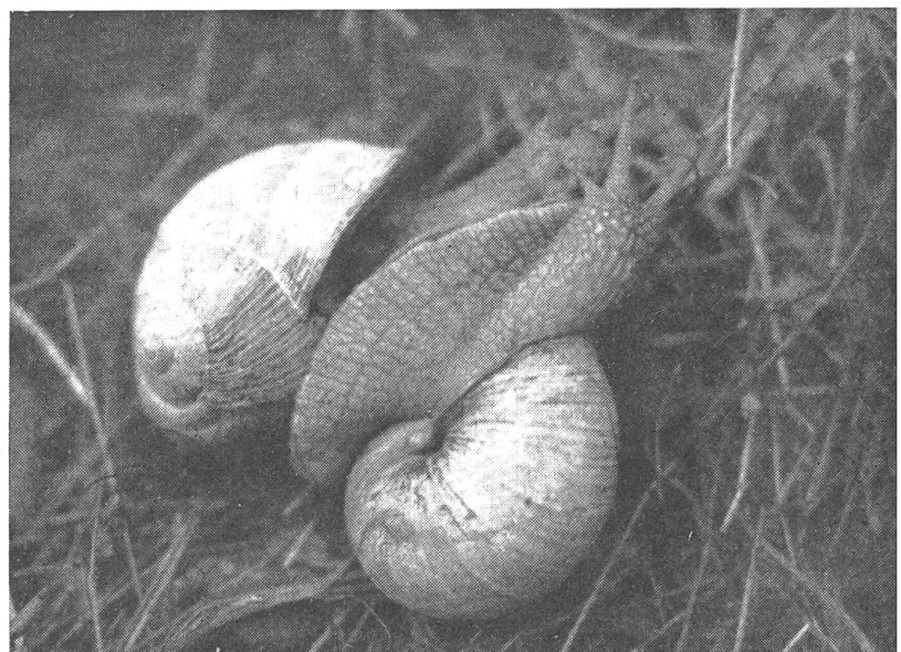
Das Liebesspiel der Weinbergschnecken

Das Leben eines jeden Tieres steht in ununterbrochenem Kampf gegen den Hunger, gegen seine Feinde und nicht minder gegen alle Unbilden der Witterung. Meistens ist der Tierkörper so gestaltet, daß er den mannigfachen Gefahren und Nöten zu widerstehen vermag. Die einen Formen haben Zähne und Krallen, anderen sind besonders scharfe Sinne gegeben oder sie sind von einer schützenden Hülle umkleidet. Darüber hinaus sucht das Tier von sich aus Verstecke und Zufluchtsorte auf, wie sie eben vielfach der Zufall bietet. Aber schon auf einer niederen Stufe verlassen sich viele Tiere nicht auf diesen Zufall, indem sie sich — sei es für nur kurze Zeit, sei es als Dauerwohnung — selbst entsprechende Schlupfwinkel bauen. Tiere als Baukünstler vollbringen oft Erstaunliches, wobei naturgemäß Form und Bauweise außer-