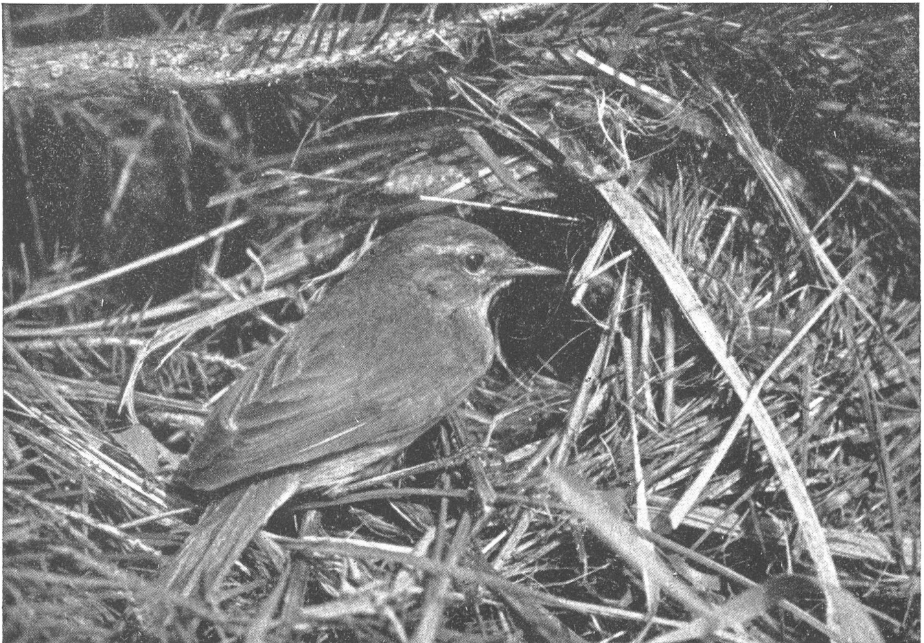
Weidenlaubsänger vor seinem backofenförmigen Kuglnest. Auch seine Verwandten, der Fitis-, Wald- und Berglaubsänger bauen gleiche Nester, die zwei letztgenannten Arten jedoch auf dem Boden. Die meist sehr gut getarnten Nester besitzen ein seitliches Einschlupfloch. Der Weidenlaubsänger wird wegen seines Gesanges auch „Zilp-Zalp“ genannt

den faulsten, dann wieder als intelligentesten Vogel bezeichnet, weil er seine Eier einfach in fremde Nester legt und sich weiter nicht mehr um seine Nachkommen kümmert, bildet unter den Singvögeln unserer Breiten eine Ausnahme. Unter ihnen finden sich viele Arten, die mit großem Geschick ihre Kinderwiegen flechten, weben oder auch — mauern. Im Frühling und Sommer, wenn die Jungen schlüpfen und großgefüttert werden, ist von all diesen Heimstätten unserer gefiederten Sänger wenig oder nichts zu sehen. Wenn aber der Herbst die Bäume und Sträucher entblättert, dann enthüllt er damit auch vielfach das „Geheimnis“ der Vogelwohntstätten. Die Bilder, die wir hier zeigen können, werden beim Erkennen einzelner Vogelnester eine gute Hilfe sein.