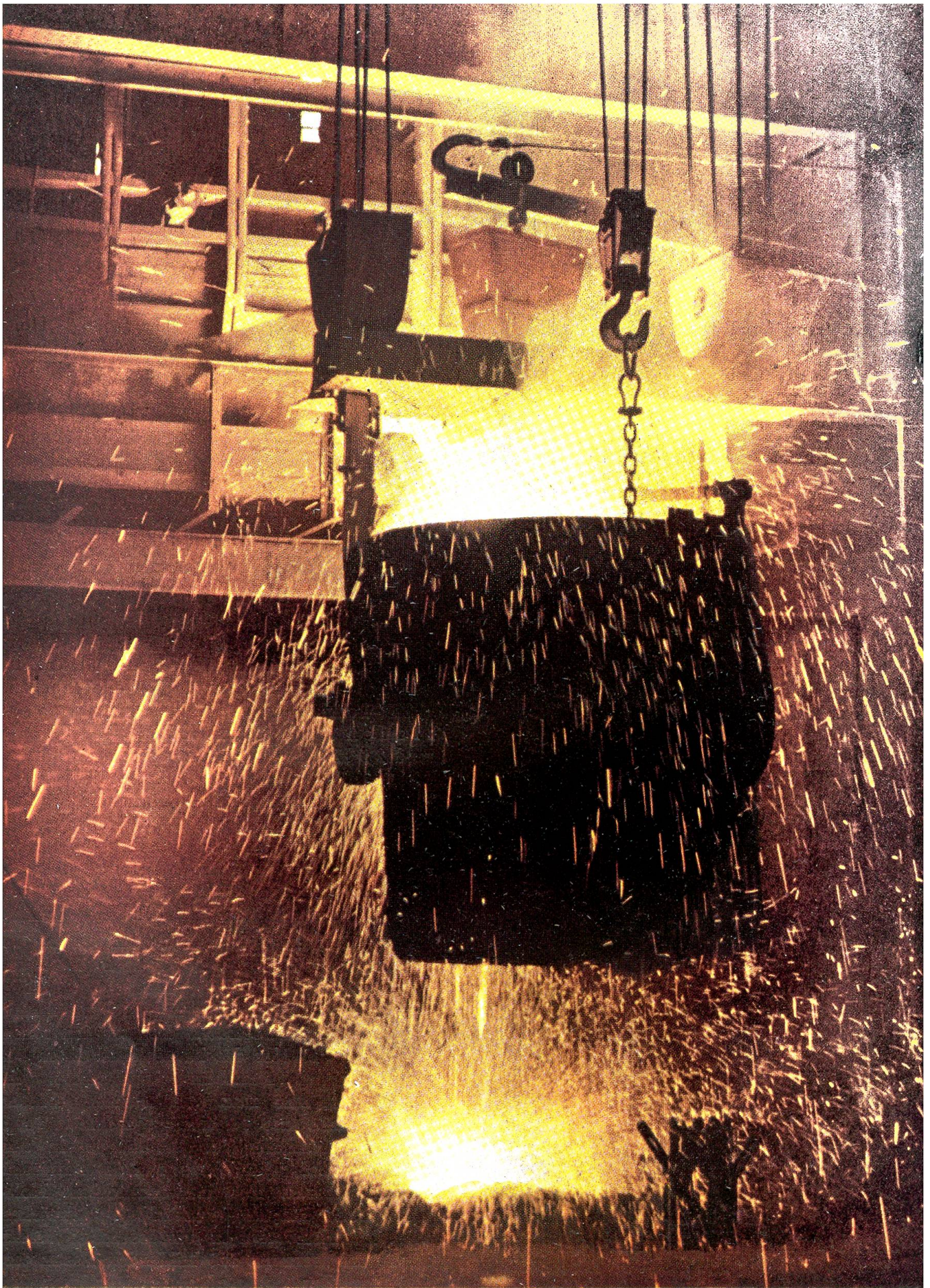
ie Herstellung hochwertiger Spezialstähle erfordert besondere Zusätze beim Schmelzprozeß, noch ehe sich der flüssige Stahl funkensprühend in die riesige Pfanne ergießt