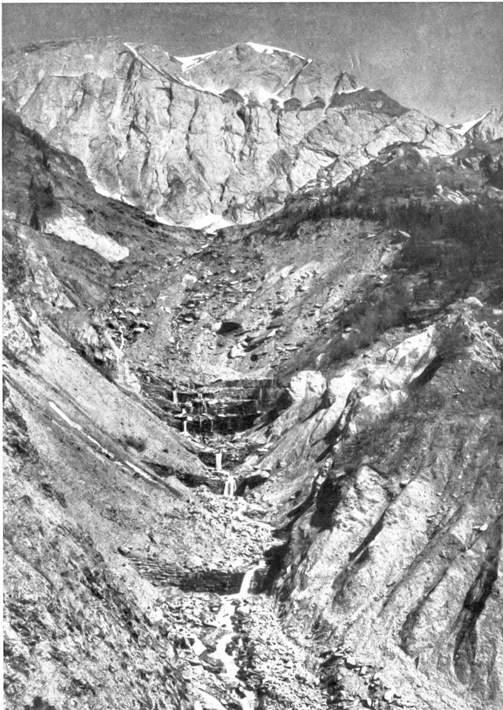
Abb. 1. Im Oberlauf des Flusses, im Gebiet der „reinen Erosion“, muß das Eintiefen und übermäßige Fördern von Geröll durch Einbau von Sperren verhindert werden

Der einem Wasserlauf durch seine Fließgeschwindigkeit gegebenen Kraft ist die doppelte