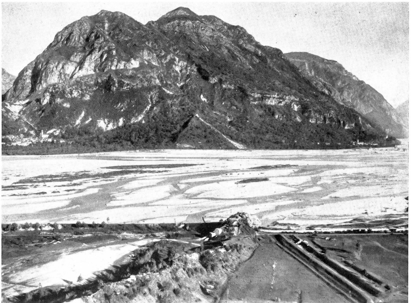
Abb. 3. Ablagerung und Erosion gleichzeitig charakterisieren die meisten Flußstrecken. Im Geröll austausch werden grobe Gerölle abgelagert und kleinere durch die Erosion in Bewegung gesetzt

Eigene Gesetze gelten für die Kleinstbestandteile, die bei den letzten geringsten Geschwindigkeiten aus dem Schweb absinken. Diese Kolloide von etwa 0,002 mm Durchmesser nämlich zeigen nach der Ablagerung eine so starke Adhäsion und Kohäsion, daß sie für eine erneute Erosion dieselbe Geschwindigkeit fordern wie ein Geröll von zehntausendmal so großem Durchmesser. Weil aber im Unterstlauf eine solche Geschwindigkeit nicht mehr vorherrscht,