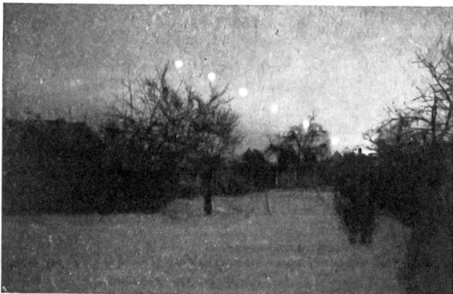
Abb. 1. Sonnenuntergang am kürzesten Tag in 50 Grad Nordbreite. Beginn der Aufnahmen 14 Uhr 30 Minuten MEZ. in viertelstündlichen Abständen

Im Baufach, in der Landwirtschaft und auch sonst ergibt sich oftmals die Frage, wann längs einer bestimmten Hausfront oder eines Hanges Sonnenschein zu erwarten ist, selbstverständlich abgesehen von den Einwirkungen des Wetters.