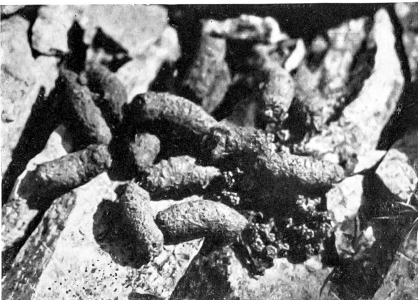
Abb. 3. Die Murrel-Losung ist walzenförmig, von jener der Mäuse durch die Größe (15 bis 20 mm lang) deutlich unterschieden, hell- bis dunkelbraun (Das Bild ist dem Buch „Fährten und Spuren“ von Heinz Scheibenpflug, erschienen im Brühlschen Verlag, Gießen, entnommen)

zu suchen, die dort, wo der Schnee eben abschmilzt, zu sprießen beginnen. Mitte oder Ende Juni gibt es dann schon Nachwuchs, und die „Katzen“, wie man in der Jägersprache die Muttertiere nennt, sind vollauf damit beschäftigt, den jungen „Afften“, wie die Murreltierjungen weidmännisch richtig benannt werden, das Allerwichtigste für ihr Leben beizubringen: das blitzschnelle Verschwinden in den Bau oder in eine der Fluchttröhren, die es im Umkreis der Bauten überall gibt. Im übersichtlichen Gelände, etwa an sonnseitigen Grashängen oberhalb der Wald- und der Knieholzgrenze, kann man die Murreltierplätze schon von weitem daran erkennen, daß ausgetretene Wege zu den verschiedenen Löchern führen, in denen die Tiere sofort verschwinden, wenn ihnen irgend etwas verdächtig vorkommt.