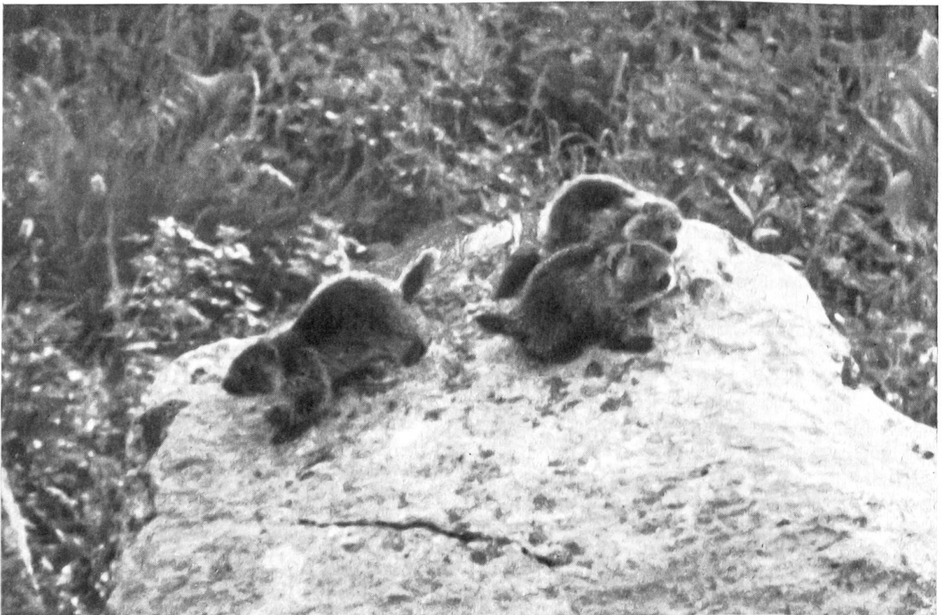
Abb. 6. Die jungen Murmeltiere, die „Affen“, wie sie in der Weidmannssprache heißen, tummeln sich unbekümmert in der Nähe des Baues, sich zunächst noch ganz auf die Wachsamkeit der alten Tiere verlassend

Die bei uns in den Alpen vorkommende Art (früher meist Arctomys marmota , heute Marmota marmota genannt) bewohnt auch die Hochkarpaten, wo sie aber bereits sehr selten ge-