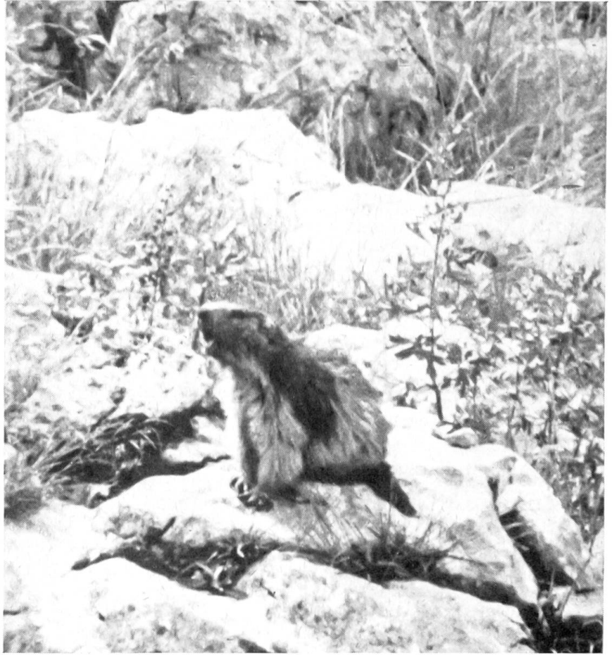
Abb. 5. Gefahr in Verzug! Laut und schrill klingt der Pfiff des „Wächters“ durch das Felskar und schon ist er auch selbst zur Flucht bereit

Der natürliche Hauptfeind der Murmeltiere, der Steinadler,