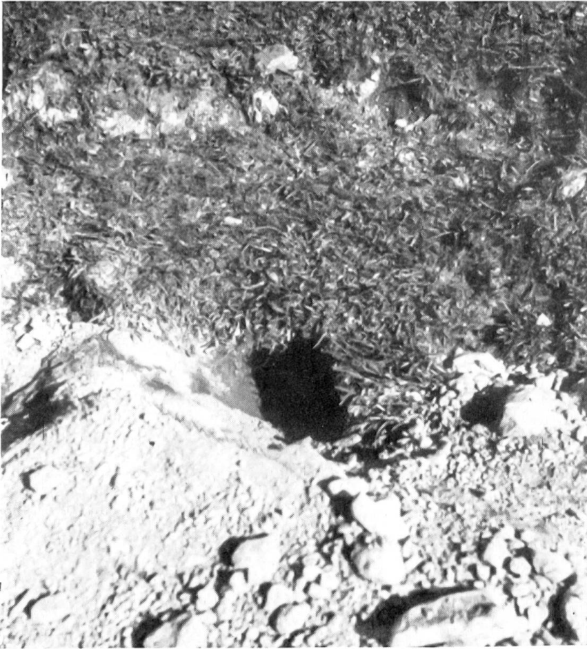
Abb. 2. Mehr als 15 cm breit ist dieser Fluchtgang, der schräg abwärts in einen Bau führt. Das ausgeworfene Erdreich und richtig ausgetretene Verbindungswege machen die Murrelbauten dort, wo sie im offenen Gelände (hier die Grashänge im obersten Fimbirtal, Silvretta) angelegt sind, meist deutlich kenntlich