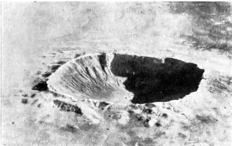
Der berühmte, große Meteorkrater in Arizona

furchtbare Entdeckung. Im Gebiet der Taiga, an der Steinigen Tungusta, erwies sich ein Gebiet von etwa 3000 km 2 ganz schrecklich verwüstet. Ungeheuer viel Wald war regelrecht umgeknickt, und zwar nach allen Seiten hin, als sei die Vernichtung von einem einzigen Zentrum ausgegangen. Man hat später tatsächlich ein Kerngebiet der Zerstörung feststellen können, und noch 120 km von diesem entfernt zeigten sich verheerende Spuren einer unheimlichen Verwüstung. Das Ereignis mußte schon weiter zurückliegen. Nun erinnerte man sich der Aussagen mancher Reisender der Transsibirischen Eisenbahn, die seinerzeit, vor 19 Jahren schon, in einer hellen Mittsommernacht eine überaus schöne Lichterscheinung wahrnahmen; damals, als ihr Zug auf einem kleinen Bahnhof gehalten hatte. Ja, und einige Zeit darauf hatten sie sogar auch einen dumpfen Knall gehört ... Die Untersuchungen bestätigten schließlich Zusammenhänge zwischen jener geheimnisvollen Lichtfontäne und der Luftdruckwelle, die um die halbe Erde gejagt war und dem alten Globus ein leichtes Schaudern über die runzlige Oberfläche laufen ließ.