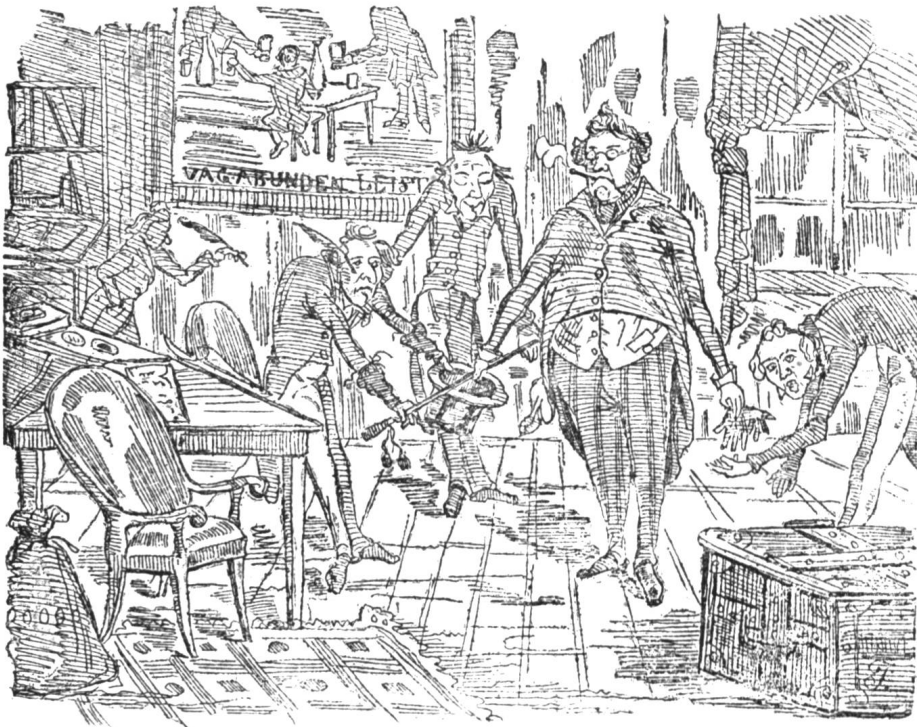
Gintritt des Justiz-Ministers in sein Bureau.