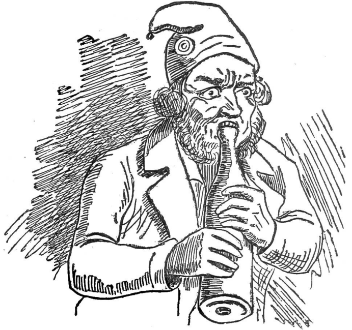
II. Der Brutal-Revolutionäre.