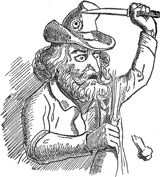
I. Der rothe Republikaner.