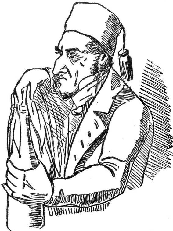
III. Der Legal-Revolutionäre.