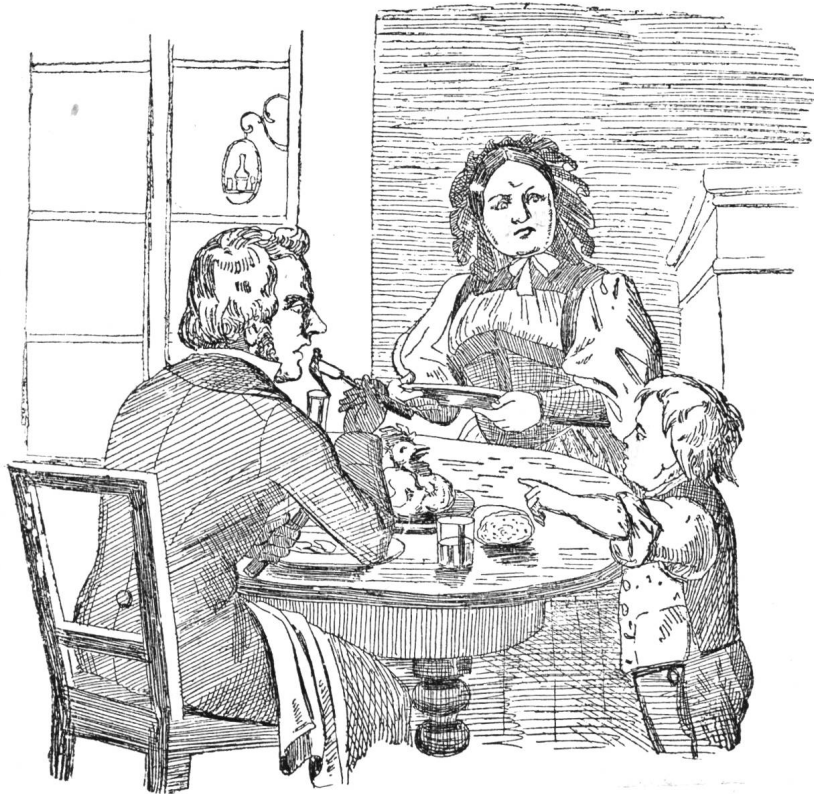
Großmüetti, gäll das isch dâ Guggel, wo nis hüt am Morge verreckt isch?