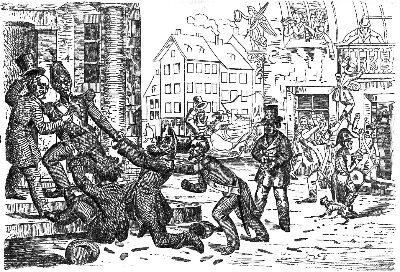
Als wie so der Präsident des Großen Rathes von Tessin es möglich zu machen sucht, die Traktanden zu erledigen.